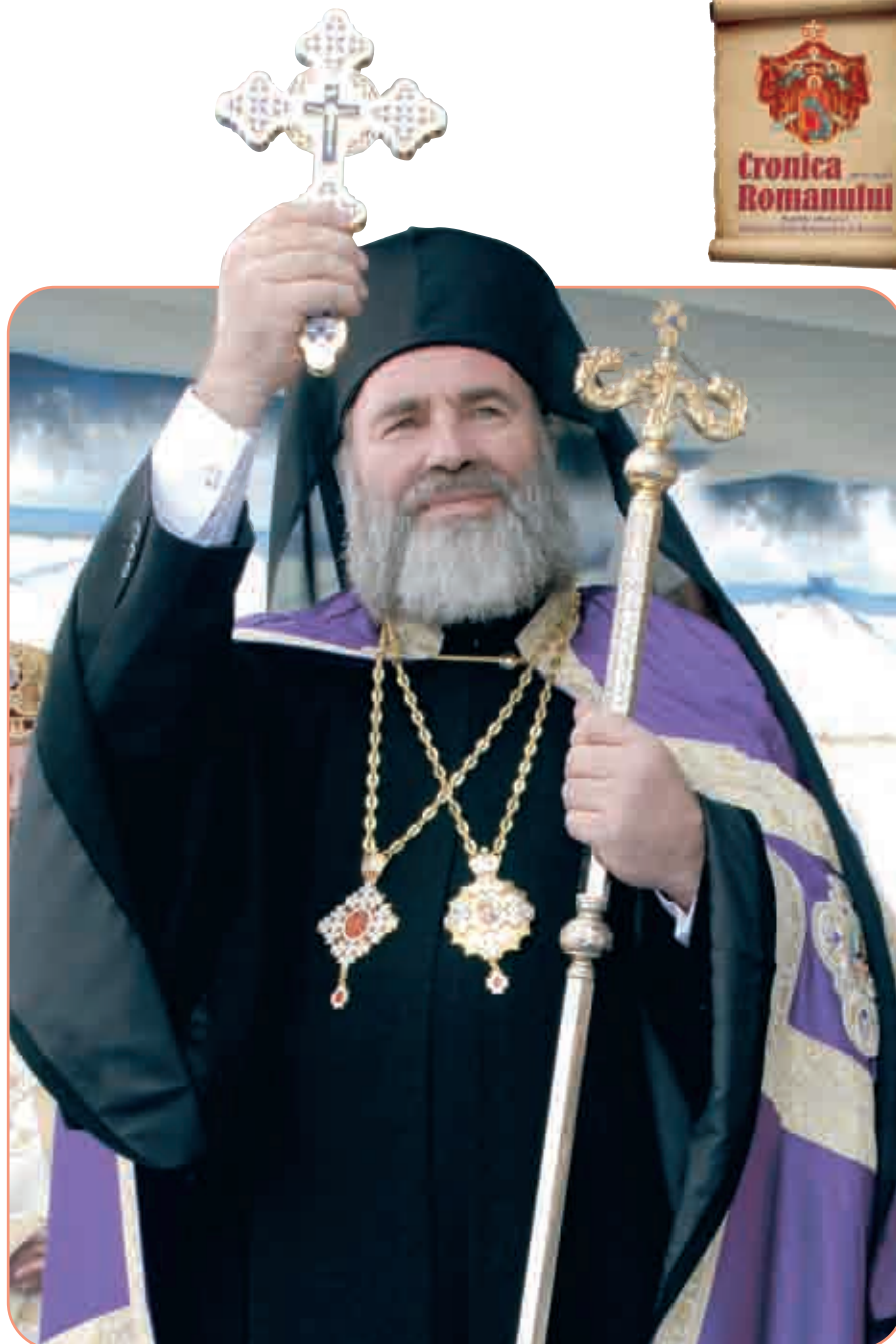
PS Ioachim Băcăuanul, Episcop-vicar al Arhiepiscopiei Romanului și Bacăului binecuvântând credincioșii

Din conținutul Tomosului Patriarhal privind înălțarea Episcopiei Romanului la rangul de