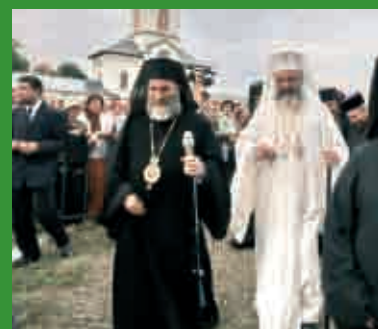
Sfințirea caselor de protocol „Episcop Lucian Triteanu” din incinta Centrului eparhial de la Roman