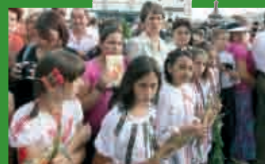
Credincioși așteptând pe Întâistătătorul Bisericii Ortodoxe Române