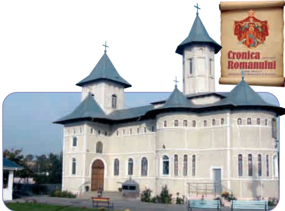
Biserica „Sf. Cuvioasă Parascheva” din Filipești a fost ridicată între anii 1997 - 2009, fiind încă un semn al dragostei pe care credincioșii eparhiei Romanului și Bacăului o au pentru Ocrotitoarea Moldovei