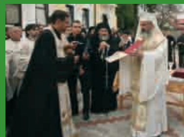
Înmânarea diplomelor „Sf. Ap. Andrei”

jeanul, Episcop-vicar al Arhiepiscopiei Craiovei, în prezența a peste 350 de preoți și a câțeva mii de credincioși din Roman, Bacău, Onești, Moinești și din alte zone ale țării, care au ținut să fie prezenți la acest eveniment istoric. La slujba religioasă de la Roman, pe lângă autorități locale și județene, a fost prezent și Traian Băsescu, președintele României, care, din mulțime, a asistat la ultima parte a Sfintei Liturghii.