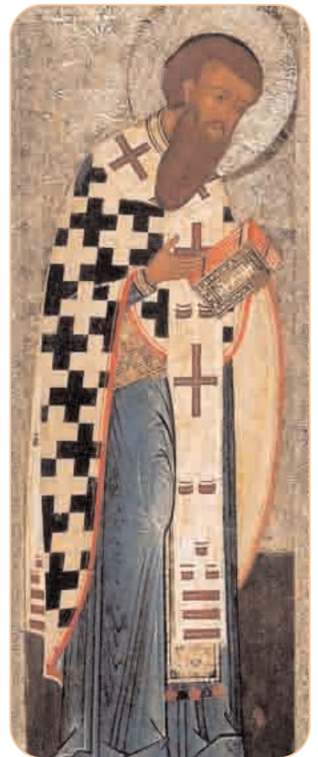
Sfântul Vasile cel Mare, Mare Dascăl al lumii și Ierarh

La vârsta de cinci ani, Vasile își începe școala, urmată de studii superioare, potrivit epocii. Școala primară o face în Cezareea, continuă la Constantinopol și Atena, unde întâlnește pe Sfântul Grigorie de Nazianz, cu care leagă o strânsă prietenie, model celebru pentru adevăratele prietenii dintre oameni. După studii aprofundate, revine în cetatea natală și ocupă un post de profesor de retorică. Nu rezistă nici tentațiilor orgoliului, nici celor ale lumii, așa că muștrările surorii sale,