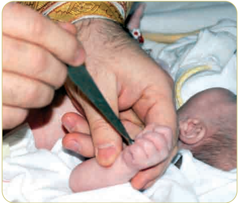
Cel care oficiază botezul unge trupul noului botezat cu Sfântul și Marele Mir, zicând aceste cuvinte: „Pecetea harului Duhului Sfânt“