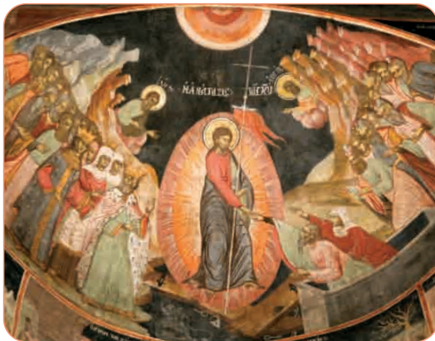
Învierea Domnului, frescă din Catedrala arhiepiscopală „Sfânta Parascheva“ din Roman (secolul al XVIII-lea)

În perioada Postului Mare s-a amintit de nenumărate ori ce este păcatul. În accepțiunea vieții ascetice, este mai mult decât o culpabilitate morală sau încălcarea unei reguli impuse; este incapacitatea noastră de a ne realiza propriul destin. Adică, păcatul ne sugerează faptul că trebuie să refuzăm ieșirea din această lume. De aceea omul păcătos are teamă de moarte și încearcă, prin diferite mijloace, să anuleze sau