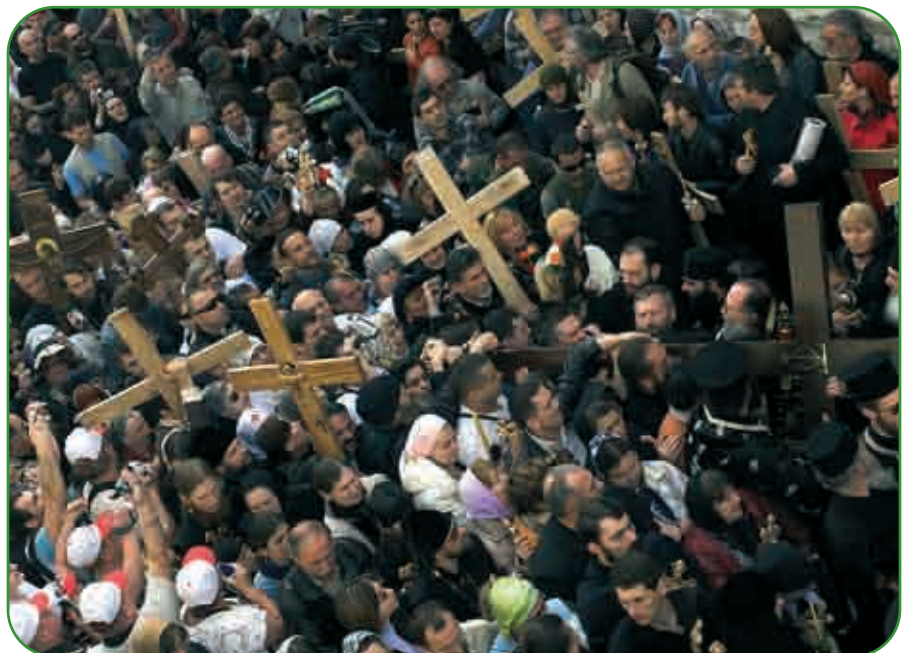
Pelerini pe Drumul Crucii, în Vinerea Mare la Ierusalim

Denia de vineri seara, adică utrenia din sfânta și marea Sâmbătă, este de fapt o slujbă de înmormântare. Coborât de pe Cruce, la momentul Vecerniei de mai înainte, Mirele este plâns și așezat în Mormânt. „În mormânt cu trupul, în iad cu sufletul, în rai cu tâlharul și pe scaun cu Tatăl și cu Duhul“ este Iisus Hristos. Scara deniilor se întinde peste istorie, unind închipuirea cu realitatea și devenind ea însăși întruparea visului Patriarhului Iacov la Betel. (Pr. Petru RONCEA)