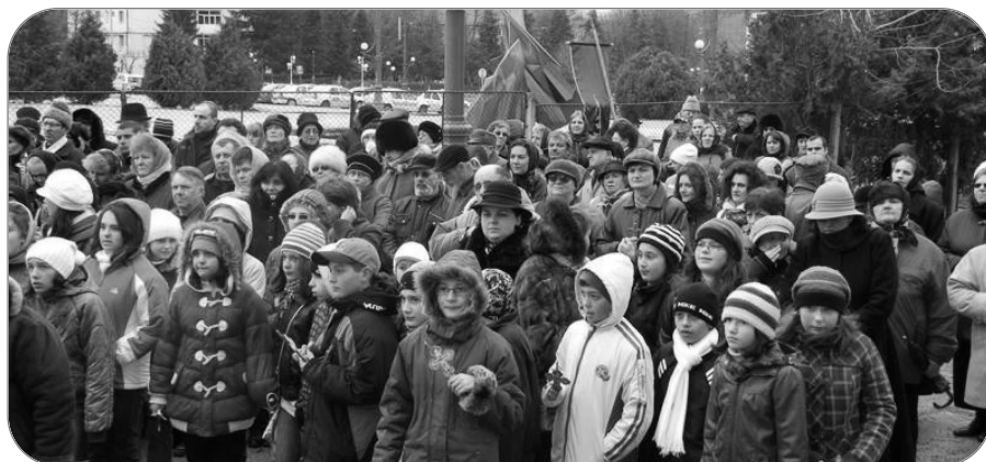
În ziua de 27 martie, elevii Școlii „Ghiță Mocanu” s-au alăturat sutelor de credincioși oneșteni care au luat parte la o procesiune religioasă dedicată Sfintei Cruci

Acțiunea a avut loc în cadrul unui parteneriat care se derulează de doi ani de zile între așezământul social-filantropic și școală. După cum a menționat pr. Ilarion Mătă, parteneriatul amintit a adus, de-a lungul timpului, multe momente de bucurie bătrânilor, prin activitățile sensibile organizate de copiii școlii: „Cu alte ocazii, copiii au venit să-i colinde pe bătrâni, să realizeze spectacole și alte evenimente de-a lungul anului. Ne-am angajat să continuăm acest parteneriat și cu ocazia sărbătorilor pascale.