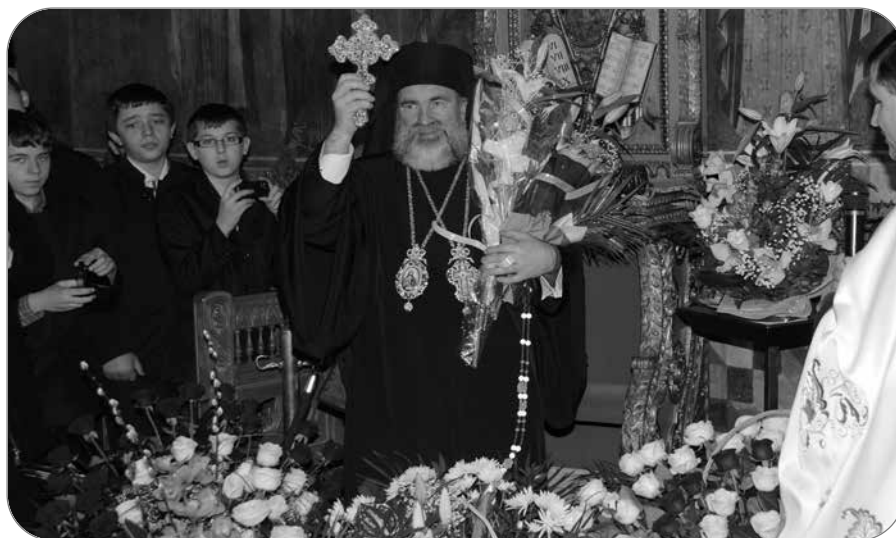
Preasfințitul Ioachim Băcăuanul a împlinit, pe 29 martie, 57 de ani. Momentul aniversar a fost marcat prin oficierea Liturghiei darurilor mai înainte sfințite în Catedrala Arhiepiscopală

În 1991 a fost trimis cu o bursă de studii doctorale la Institutul „Saint Serge” din Paris. „Aveam să plec din mijlocul Carpaților, după ce