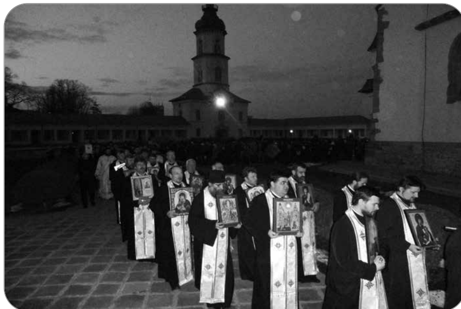
Catedrala Arhiepiscopală din Roman, procesiune cu icoane și moaște în Duminica Ortodoxiei

Seara duhovnicească din Duminica Ortodoxiei s-a încheiat, la Roman, în jurul orei 18:00, cu o procesiune, în cadrul căreia preoții și credincioșii prezenți au purtat icoanele și sfințele moaște aflate în tezaurul Catedralei arhiepiscopale. Astfel, cu toții, împreună, clerici și credincioși ai eparhiei Romanului au făcut un gest de mărturisire și de întărire în credință, potrivit acestui moment din urcușul duhovnicesc al Postului Mare. (pr. Ctin GHERASIM)