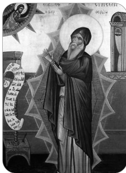
Sfântul Simeon Noul Teolog (949–1022) este pomenit de Biserica Ortodoxă în ziua de 12 martie

Împărtășirea cu Hristos, nu numai că-L face prezent pe Fiul lui Dumnezeu în cel ce gustă din Potir, ci Îl lasă pe Acesta să se sălășuiască și să preschimbe, să înnoiească făptura. Hristos se întrupează în fiecare credincios, care primește comuniunea de har a Sfințelor Taine. Prin împărtășire, spune Sfântul Simeon Noul Teolog în Imnul 15: „Ne facem mădulare ale lui Hristos (I Cor. 6, 15), iar Hristos se face mădularele noastre, Hristos devine mâna mea, Hristos devine piciorul meu, ticătosul, iar eu, ticătosul, devin mână a lui Hristos și picior al lui Hristos; mișc mâna și Hristos întreg este mâna mea – căci neimpărțită este Dumnezeirea dumnezeiască, înțelegăm! -, mișc piciorul și, iată, fulgeră ca Acela.“