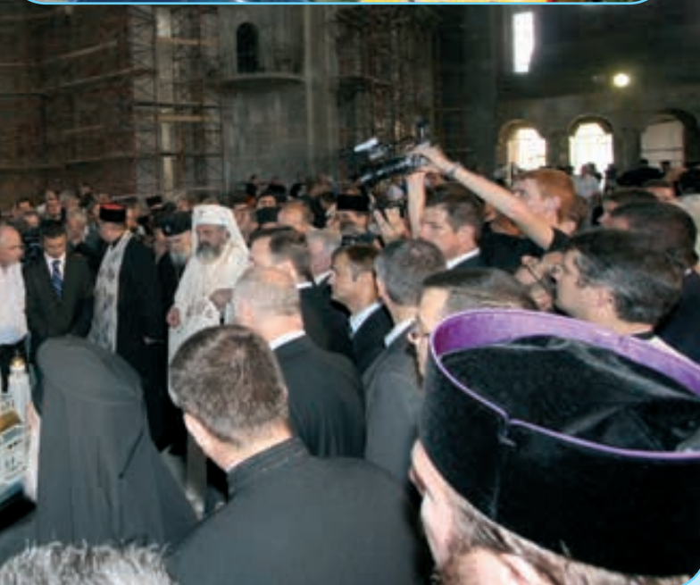
Vizita PF Părinte Patriarh Daniel pe șantierul din Bacău (septembrie 2009)