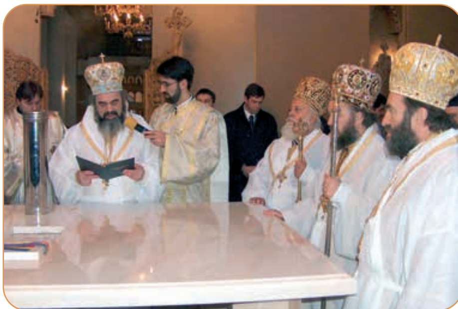
La 18 octombrie 2003, în calitate de Mitropolit al Moldovei și Bucovinei, PF Părinte Patriarh Daniel, alături de alți ierarhi ai Sfântului Sinod al Bisericii Ortodoxe Române, a oficiat slujba de sfințire a Bisericii „Sf. Dumitru” din Municipiul Bacău

După câțiva ani, la 18 octombrie 2003, în calitate de Mitropolit al Moldovei și Bucovinei, PF Părinte Patriarh Daniel a fost prezent la Bacău, unde, alături de alți ierarhi ai Sfântului Sinod al Bisericii Ortodoxe Române, a oficiat slujba de sfințire a Bisericii „Sf. Dumitru” din Municipiul Bacău, unul dintre cele mai mari lăcașuri de cult construite în România după 1990. Cu această ocazie au fost aduse, pentru prima oară la Bacău, moaștele Sfântului Mare Mucenic Dimitrie.