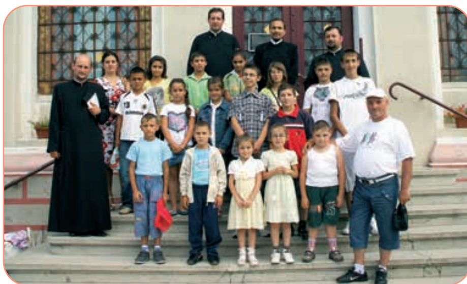
Coordonatori și beneficiari ai proiectului „Alege Școala“ din Protopopiatul Buhuși

În taberele organizate în cadrul proiectului „Alege Școala“ copiii au ocazia de a participa la