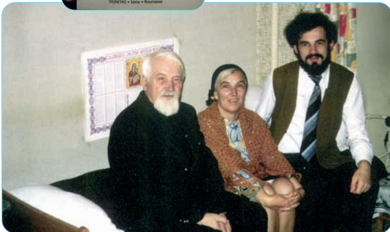
Părintele Dumitru Stăniloae a fost mentorul PF Părinte Patriarh Daniel

Activitatea mea în Franța a fost încununată pe plan cultural cu înscrierea la doctorat. Pentru aceasta, recunoștința mea se îndreaptă către Prefericitul Părinte Patriarh Daniel, care m-a încredințat eminentului profesor de teologie, recunoscut ca unul dintre cei mai mari teologi laici ai secolului al XX-lea, Olivier Clément, cel care mi-a fost îndrumător științific la lucrarea de doctorat: „La Déification de l’homme d’après la pensée du Père Dumitru Stăniloae“. Lucrarea a apărut în volum la Editura Trinitas din Iași, cu binecuvântarea Preafericitelui Părinte Patriarh Daniel, pe atunci Mitropolit al Moldovei și Bucovinei, la 10 ani de la trecerea în veșnicie a Părintelui Stăniloae - mentorul teologic al Preafericirii Sale.