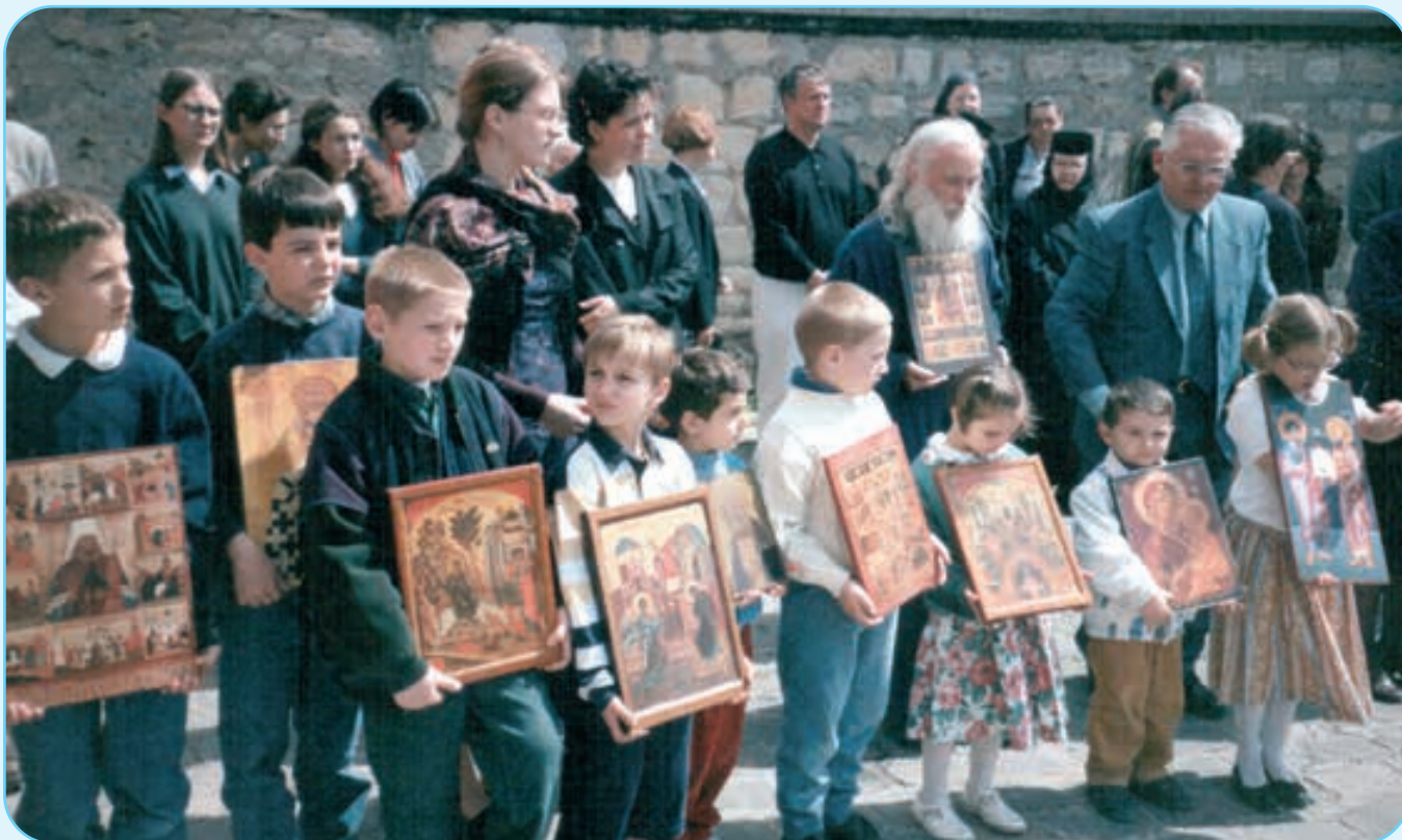
Procesiune cu câteva dintre icoanele donate de PF Părinte Patriarh Daniel așezământului monastic de la Rosiers, Franța

La inițiativa și cu binecuvântarea Părintelui Patriarh Daniel am avut posibilitatea de a studia în străinătate, unde mi-am aprofundat cunoștințele teologice, dar am învățat și cum să-mi struc-