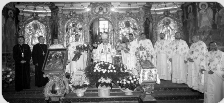
La Sf. Liturghie arhierescă oficiată în ziua onomasticii sale la Catedrala Arhiepiscopală din Roman, PS Episcop Ioachim Băcăuanul a fost înconjurat de un sobor de preoți și diaconi

Noul așezământ social-filantropic din municipiul Roman va constitui încă un centru important, pe lângă celelalte deschise pe cuprinsul eparhiei, unde se vor derula programul „Școală