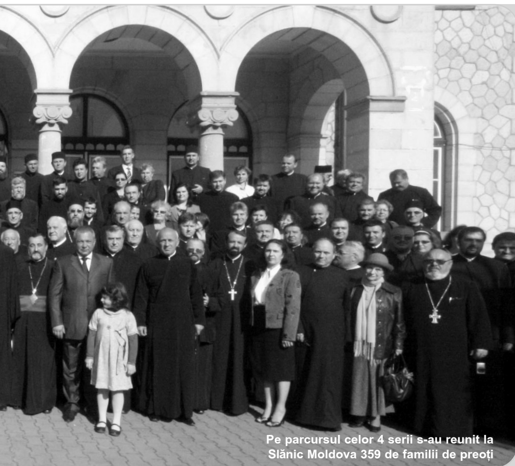
Pe parcursul celor 4 serii s-au reunit la Slănic Moldova 359 de familii de preoți