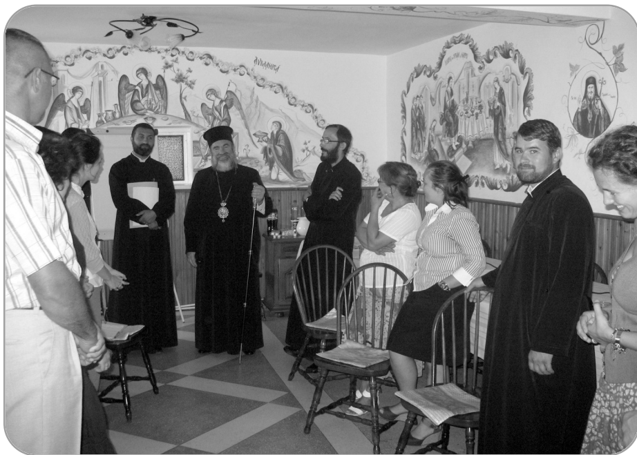
Deschiderea oficială a cursurilor de formare profesională pentru persoanele care vor lucra în centre de consiliere a dependenților de alcool, de la Tisa Silvestri, a fost făcută de PS Ioachim Băcăuanul, Episcop-vicar al Arhiepiscopiei Romanului și Bacăului

Obiectivele cursului au fost: prezentarea într-o manieră interactivă a problematicii alcoolismului ca boală primară progresivă, cronică și fatală, dezvoltarea abilităților de consiliere în adicții și împăr-