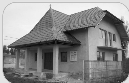
Așezământul social „Micul creștin” va funcționa în cadrul parohiei „Sf. Ioachim și Ana” din Roman

Frumusețea liturgică a zilei a fost încununată și de hirotonia întru preot a unui tânăr diacon,