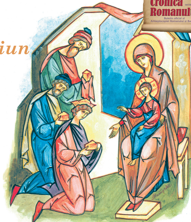
Magii de la Răsărit au văzut steaua care vestea Nașterea lui Hristos și au venit să I se închine

La câțva timp de la nașterea lui Iisus, magii (oameni înțelepți din Persia sau Mesopotamia) au venit la Ierusalim. Ei au întrebat: „Unde este Regele iudeilor, Cel ce S-a născut? Căci am văzut la răsărit steaua Lui și am venit să ne închinăm Lui.“ Întrebarea lor a tulburat pe Irod și poporul din Ierusalim. Irod, adunând pe arhierii și pe cărturari, i-a întrebat unde avea să se nască Mesia. Ei au răspuns: „În Betleemul Iudeii, că așa este scris de prorocul“. Irod, chemând în ascuns pe magi, i-a întrebat când a apărut steaua. Apoi i-a trimis în Betleem și le-a zis: „Mergeți și cercetați cu demănuțul despre Prunc și, dacă Îl veți afla, vestiți-mi și mie, ca, venind și eu, să mă închin Lui“. După ce l-au ascultat pe rege, magii au plecat, iar steaua pe care o văzuseră în răsărit mergea înaintea lor, până ce a ajuns și s-a oprit deasupra locului unde era Pruncul Iisus. S-au bucurat când au văzut că steaua s-a oprit. Ei L-au găsit pe Pruncul Iisus împreună cu Maria, Maica Lui, și i s-au închinat. Deschizându-și bagajele, I-au adus lui Iisus daruri: aur, tămâie și smirnă. Apoi, fiind înștiințați în vis de Dumnezeu, nu s-au mai întors la Irod, ci au plecat spre țara lor pe altă cale.