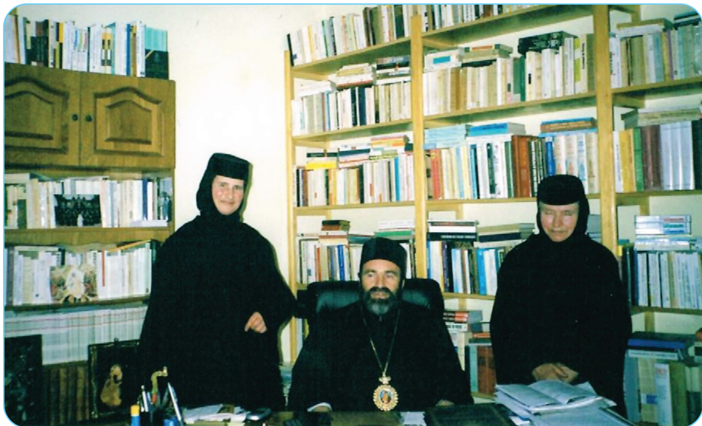
PS Ioachim Băcăuanul: „Maica Agafia nu a fost doar o maică duhovnicească, ci și o intelectuală. Puteai aborda cu ea aproape orice temă teologică și nu numai.“

➔ În ceea ce privește biografia maicii Agafia, aceasta este foarte simplă. Se poate reduce la doar 2-3 fraze: s-a născut în satul Stănița, județul Neamț, pe 13 noiembrie 1925, în ziua Sf. Ioan