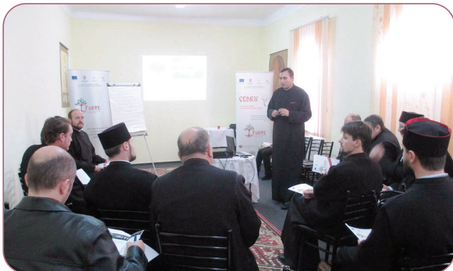
La workshopul „Atragere de fonduri/resurse în comunitate” au participat 20 de preoți și cinci cântăreți din parohiile Protopopiatului Roman

La workshopul „Atragere de fonduri/resurse din comunitate” au participat 20 de preoți și cinci cântăreți din parohiile Protopopiatului Roman interesați de mecanismele de atragere de fonduri din comunitate pentru îmbunătățirea și susținabilitatea activităților sociale. „Acest curs a oferit posibilitatea preoților noștri să afle noi informații și modele structurate, utile în atragerea de fonduri din comunitate. Preoții sunt implicați în multiple activități ce au caracter social-filantropic, cultural, pastoral-misionar și administrativ-gospodăresc. De aceea, acest curs le-a oferit