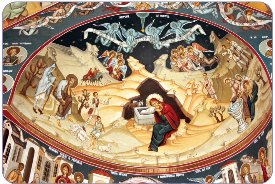
Icoana Nașterii Domnului, frescă, Biserica „Sf. Simeon Noul Teolog și Sf. Ecaterina“, Parohia Mănăstirea Cașin II, Arhiepiscopia Romanului și Bacăului

Vestea cea bună a Crăciunului este aceea că această sărbătoare ne oferă nădejdea mântuirii, prin care avem posibilitatea să ne facem părtași la viața în Dumnezeu și cu Dumnezeu, în puterea Duhului Sfânt. De aceea, Crăciunul nu este doar o chemare la sărbătoare, ci, în același timp, o chemare la vigilență. Dumnezeu ne cheamă prin acest eveniment să deschidem bine ochii așa cum au făcut-o păstorii din Betleem și magii de la Răsărit, apoi toți ceilalți semeni ai noștri care s-au succedat de-a lungul secolelor până astăzi. Pentru