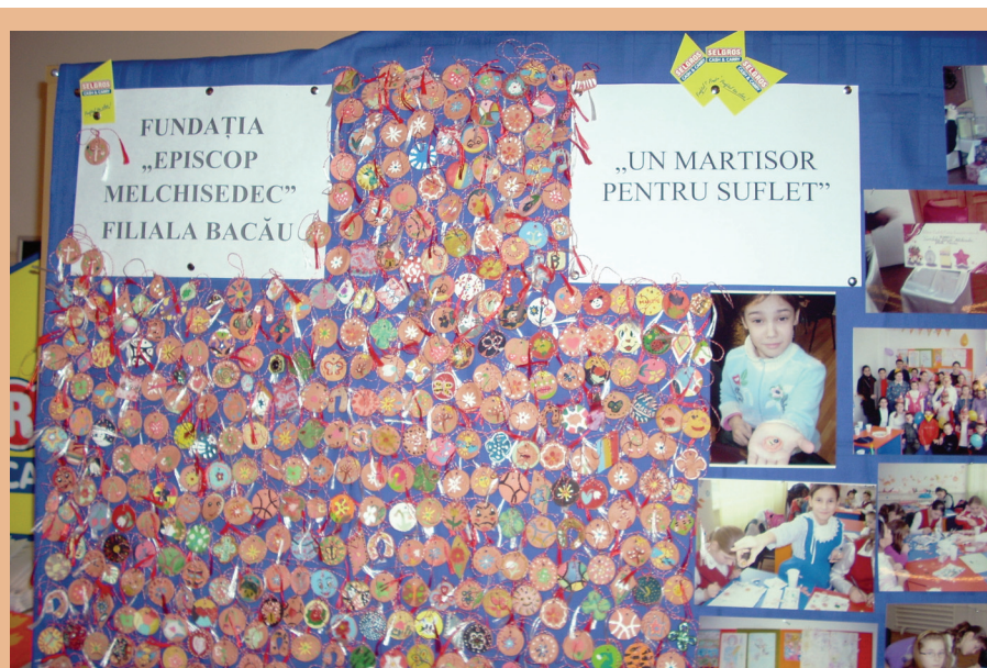
Copiii din cadrul Centrului „Sf. I. Botezătorul” Bacău au realizat mărțișoare cu care au participat la o acțiune de strângere de fonduri pentru susținerea activităților Fundației „Episcop Melchisedec” - Filiala Bacău