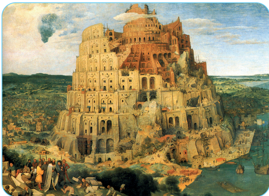
Reprezentare plastică a Turnului Babel, tablou realizat de Pieter Bruegel cel Bătrân, 1564

Alături de construirea turnului, capitolul 11 din Facerea istorisește și zidirea cetății Babilon, echivalent al orașului blestemat, opusul Ierusalimului ceresc în plan simbolic, o minunăție viciată, care, prin frumusețile și intențiile ei, a debusolat pe om, orientându-l spre un sens greșit al înțelegerii vocației sale ontologice. Babilonul simbolizează triumful neîmplinit al unei lumi care evaluează doar latura perisabilă a omului și de aceea eșecul său este atât de zguduitor. Babel reprezintă antiteza Ierusalimului ceresc, ce ne înfățișează o societate goliță de valențe spirituale, sortită prin aceasta risipirii, iar refacerea unității inițiale pierdute devine viabilă doar ca acțiune chentocă-filantropică dumnezeiască. Apocalipsa lui Baruch prezintă toate amănuntele legate de construirea turnului, înfățișându-l ca pe o lucrare contrară naturii. De aceea, după părerea lui pseudo-Philon, ea nici nu a fost finalizată, ci s-a dărâmat parțial datorită unui vânt puternic sau cutremur.