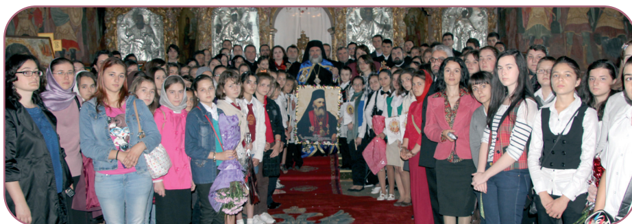
Premierea olimpicilor a fost pusă sub semnul serbării a 120 de ani de la mutarea la ceruri a vrednicului de pomenire episcop Melchisedec Ștefănescu, care a fost un însemnat ctitor de școală și cultură românească

Cei mai buni elevi la Disciplina Religie, care învață în școlile aflate pe raza județului Bacău, au fost premiați de Preasfințitul Ioachim Băcăuanul, Episcop-vicar al Arhiepiscopiei Romanului și Bacăului, vineri, 1 iunie, la Catedrala arhiepiscopală „Sf. Cuv. Parascheva” din Roman, în cadrul unei ample ceremonii, la care au participat 160 de elevi.