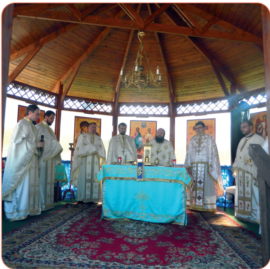
Hramul de vară al Mănăstirii Calapodești adună în fiecare an din ce în ce mai mulți credincioși în rugăciune