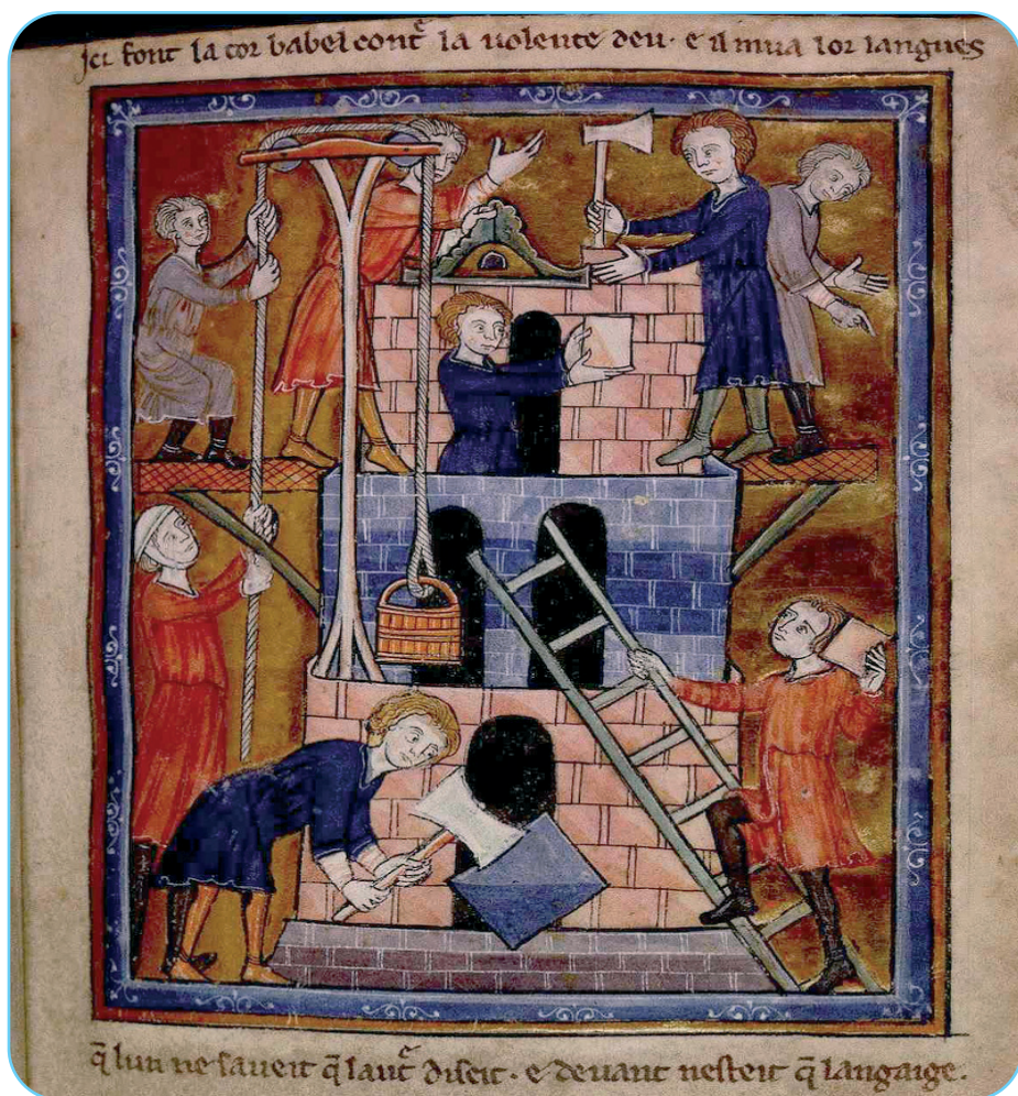
Ridicarea Turrului Babel, miniatură din 1250, Biblioteca Universității din Manchester, Marea Britanie

Un alt episod „biblic” al înălțării de tip babilonian este relatat de Simion Metafrastul, atunci când ne relatează disputa lui Simon Magul cu Apostolul Petru la Roma. După ce vrăjitorul Simon simulează primirea botezului creștin și cere apostolilor primirea Duhului Sfânt pentru a putea face și el minuni asemenea lor, el îi uimește pe locuitorii Romei cu înșelăciunile sale demonice, iar pentru a-l impresiona pe prietenul său, împăratul Nero, și pentru a fi recunoscut ca având o putere mai mare decât cea a lui Petru, acesta se urcă pe un templu și în fața romanilor se înalță la