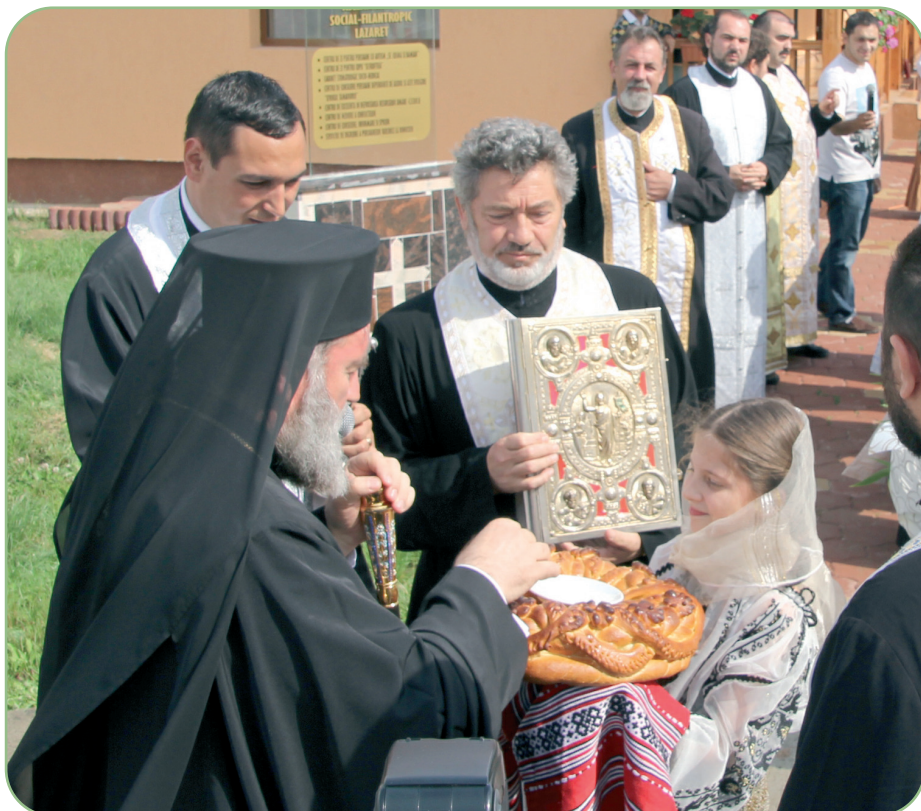
Sosit pentru sfințirea Așezământului social-filantropic de la Lazaret, PS Episcop Ioachim Băcăuanul a fost întâmpinat cu pâine și sare

Legătura dintre Bacăul anilor 90 și episcopul-vicar al Eparhiei Romanului și Bacăului este cu atât mai minunată, cu cât lasă de înțeles modul în care Dumnezeu rănduiește lucrurile în această lume. „Între anii 1991-1995, participam ca invitat al Ambasadei Române și al municipalității din Soultzmatt-Alsacia, la un parastas pe care îl oficiam la cea mai mare necropolă militară românească din Franța, unde au murit peste 1200 de soldați români în Primul Război Mondial. Era o slujbă de pomenire într-un cimitir în care erau îngropați, alături de cei peste 2000 de prizonieri români, și bulgari, ruși sau greci. La aceste parastase, am văzut venind și un bătrân care asista cu multă smerenie și răbdare la toate rugăciunile citite pentru eroii neamului nostru. Am intrat în vorbă cu el și mi-a mărturisit că avea 80 de ani și venea la cimitir în amintirea tatălui său, care a murit de tifos într-un azil special, fiind înmormântat în cimitirul Lazaret din Bacău. «Eu nu știu pe unde este acest cimitir,