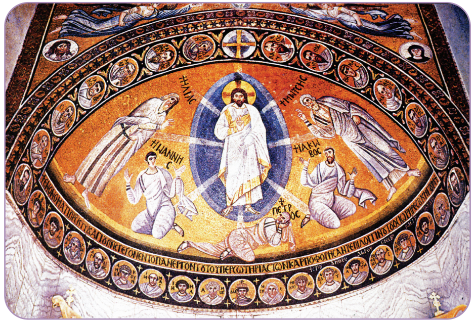
Datând din secolul al VI-lea d.Hr., mozaicul în care este reprezentată Schimbarea la Față a Domnului, din Mănăstirea „Sf. Ecaterina” de pe muntele Sinai, a devenit modelul iconografic canonic al acestui subiect.

Locul central pe care-l ocupă această temă în preocupările Părinților rezultă din faptul că ea confirmă posibilitatea cunoașterii lui Dumnezeu de către om, fiind în același timp o anticipare eshatologică a timpului parusiac, când totul va fi