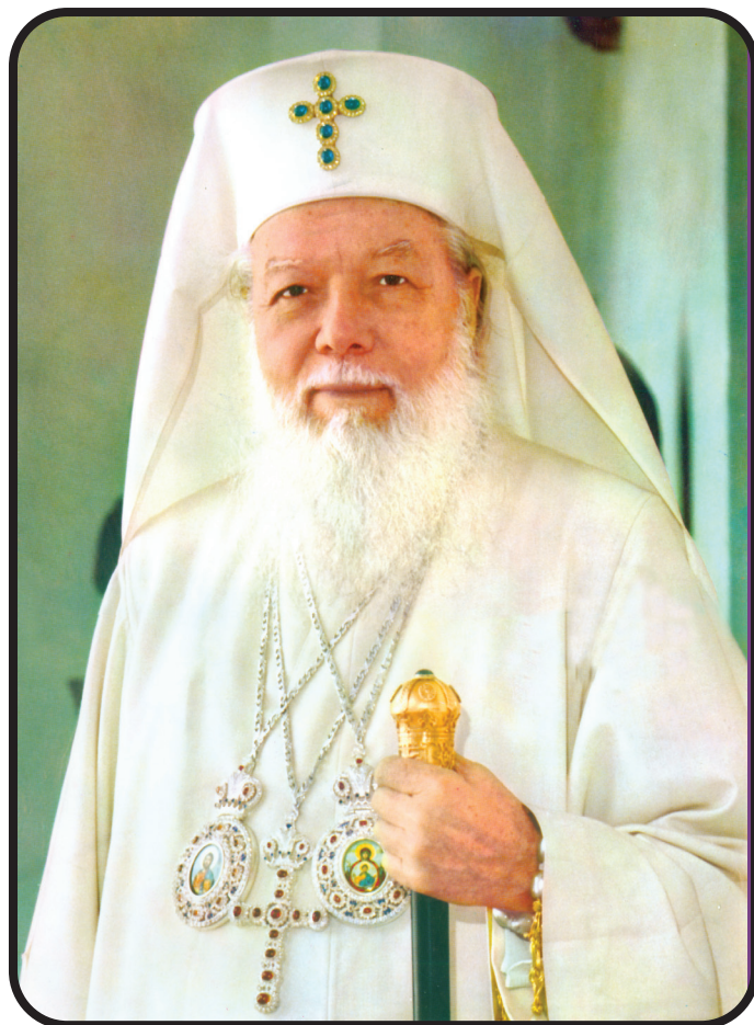
Preafericitul Părinte Teoctist Arăpașu (1915 - 2007)

Mai spun încă o dată, că am fost foarte impresionat de liniștea și starea de reculegere în care s-a desfășurat întreaga slujbă și îndeosebi, momentul procesiunii și al punerii sale în mormântul anume pregătit, unde este alături de predecesorii săi Miron, Nicodim și Justin - vrednicii patriarhi înaintași pe Scaunul istoric și duhovnicesc al Țării noastre Românești! Am mai remarcat în acest context că lumea conștientizează adevărul și realitatea că nu va putea fi elaborată istoria contemporană a Bisericii Ortodoxe Române, și a