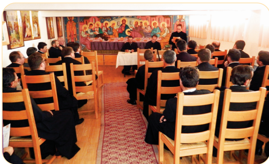
Lunar, preoții din Protoieria Sascut se întâlnesc în cadrul conferințelor pastoral misionare, pentru a dezbată temele propuse de Sf. Sinod al BOR, dar și pentru a lua la cunoștință diverse hotărâri administrative.

Ședința a continuat cu discuții și completări, după care s-au dezbătut diverse probleme administrative. (sursa: www.protoieriasascut.ro )