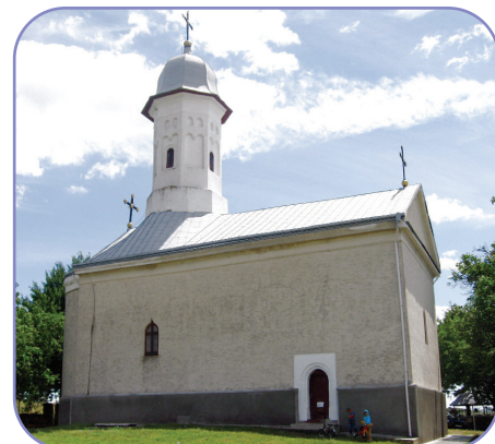
Hagigadarul este loc de pelerinaj continuu de cinci secole, atât pentru armeni, cât și pentru credincioșii români sau de alte naționalități care aparțin diverselor culte - ortodocși, catolici. În ziua de duminică, 12 august, de sărbătoarea Adormirii Maicii Domnului, pelerinii urcă în genunchi colina, în vârful căreia se află clădirea mănăstirii cu hramul „Sfânta Născătoare“, pe care o ocolesc de trei ori, închinându-se la fiecare colț și punându-și câte o dorință, după care asistă la Sfânta Liturghie.

întrunit pentru manifestările culturale: comunicări științifice, exprimarea de opinii, conferirea unor distincții, agapa frățească, etc..