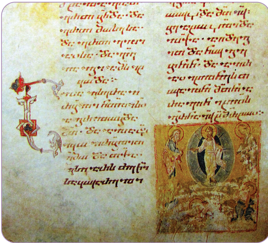
„Schimbarea la Față”, o miniatură dintr-o Evanghelie din depozitul Centrului Național de Manuscrise din Tbilisi, Georgia, datând din anul 1300

Icoana Schimbării la Față ne vorbește despre o lume ce trebuie să urce muntele transfigurării, să acceadă spre originile ei celeste, ieșind din valea plângerii și a uitării de Dumnezeu.