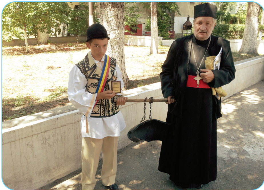
Toaca de la biserică „Sf. Împărați” din Oituz este un obuz explodat, rămas din primul Război mondial, a cărui formă a permis întrebuințarea lui la biserică.

Toaca de la Biserica „Sf. Împărați” din Oituz este una deosebită. Acum 30 de ani, când am venit preot aici, așa am găsit-o la biserică, în clopotniță. Este un obuz explodat din Primul Război Mondial, a cărui formă este cea pe care o