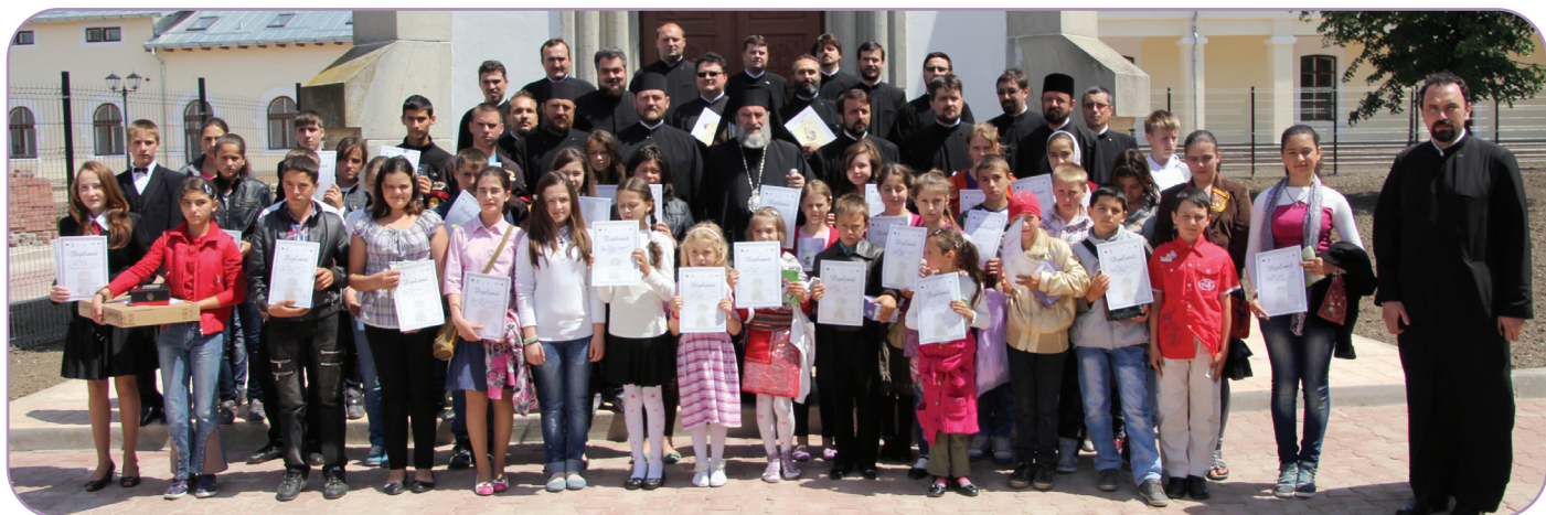
Trei sute de copii, din cele 6 protopopiate ale Eparhiei Romanului și Bacăului, au participat la concursul de eseuri „Alege Școala“