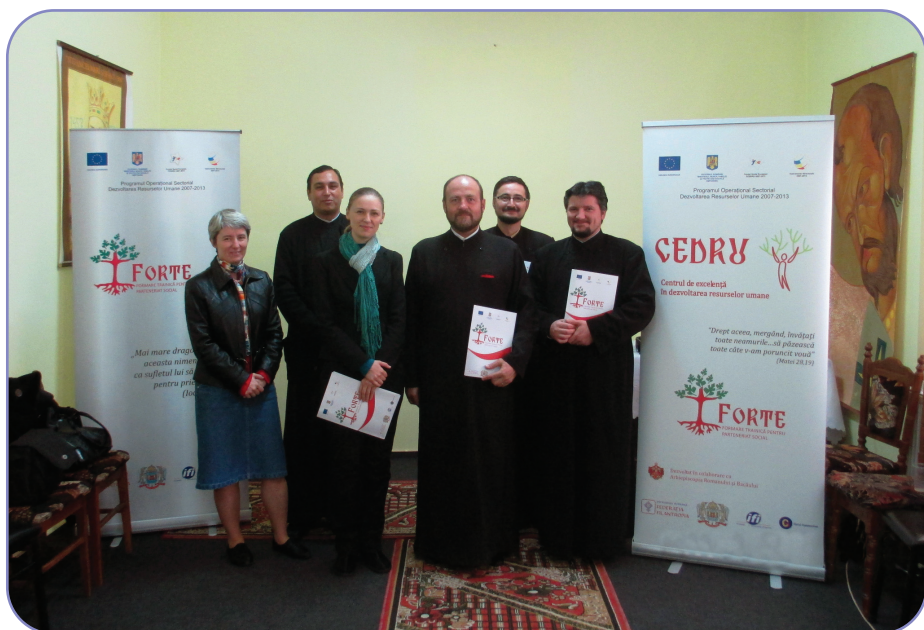
Prin proiectul FORTE al Patriarhiei Române s-a început procesul implementării strategiei de dezvoltare a serviciilor sociale oferite de Arhiepiscopia Romanului și Bacăului

Pentru susținerea serviciilor sociale acreditate existente pe raza Eparhiei Romanului și Bacăului au fost depuse spre finanțare numeroase proiecte sociale, la diferite autorități finanțatoare, după cum urmează: Fundația „Episcop Melchisedec”: „Centrul de consiliere, terapie și integrare a copiilor autiști în comunitate”, Fundația „Episcop Melchisedec” Filiala Bacău: proiectul „Alege Independent!” - pentru activitățile