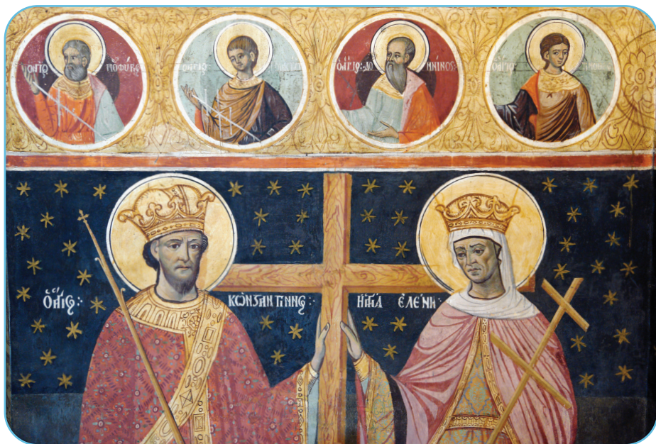
Icoana Sf. Împărați Constantin și Elena, frescă din Catedrala Arhiepiscopală din Roman, sec. al XVIII-lea

În contextul eclectic al gândirii și religiozității specifice lumii romane contemporane perioadei de început al Creștinismului, omul de tip nou, constituit după chipul celui pe care-l adora, era considerat incompatibil și indezirabil societății romane. Conflictul creștinismului cu păgânismul reieșea din contrastul fundamental dintre modul de a înțelege lumea și realitatea specifice celor două. Sincretismul și toleranța față de toate formele de religiozitate, imoralitatea, idolatria și politeismul, ca elemente specifice păgânismului roman, lipseau Creștinismului și de aceea el era evaluat ca „superstiție nouă și dăunătoare” (Suetoniu), ca apostaziase de la credința strămoșilor și se manifesta ca un cult periculos ce apela la prac-