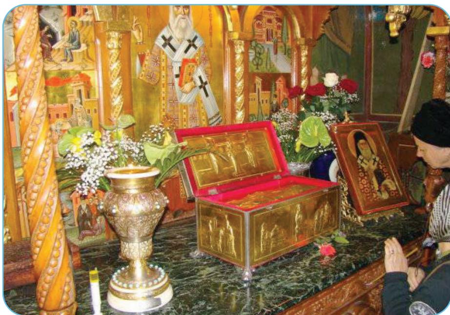
Catedrala patriarhală din București adăpostește un fragment din moaștele Sfinților Împărați Constantin și Elena