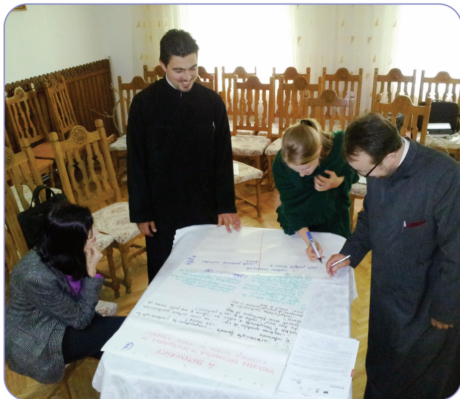
În Arhiepiscopia Romanului și Bacăului Proiectul FORTE al Patriarhiei Române este în plină desfășurare

Pentru specializarea angajaților din cadrul Sectorului social-filantropic, au fost organizate cursuri de formare continuă prin intermediul proiectelor Federației Filantropia a Patriarhiei Române. Astfel, pe parcursul anului 2012, persoane implicate în activitățile sociale ale Eparhiei Romanului și Bacăului au participat la cursuri de perfecționare în domeniile: planificare strategică (în cadrul activităților proiectului FORTE al Patriarhiei Române), atragere de resurse, management operational. În cadrul Centrului de Excelență în Dezvoltarea Resurselor Umane (C.E.D.R.U.) au fost efectuate pe parcursul anului 2012 cursuri de formare și workshop-uri pentru 357 beneficiari (preoți, profesori, studenți, elevi, voluntari) cu privire la dezvoltarea de servicii sociale în parohii, domeniul adicției de alcool și droguri pentru persoanele aflate în detenție la Penitenciarul Bacău, cursuri pentru preoții din protopopiatele eparhiei, din instituțiile școlare, precum și pentru voluntarii care își desfășoară activitatea în cadrul ONG-urilor Eparhiei. Aceste cursuri au avut ca tematică „Dependența de alcool și alte droguri” (3 workshop-uri), „Portret de voluntar” (3 workshop-uri), Managementul voluntarilor, Managementul timpului, Dezvoltare personală, Strângere de resurse (3 workshop-uri) și 8 sesiuni de informare susținute în cele șase protopopiate.