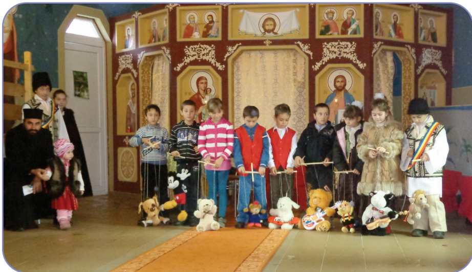
La Centrul de creație, artă și tradiție „Sfântul Apostol Andrei“ de la Hârja, copii din clasele I-VIII, după terminarea orelor de școală, pot participa la programe educative, de asistență socio-pedagogică, spirituală, psihologică și la activități recreative

Un prim reper cronologic în activitatea social-filantropică desfășurată pe cuprinsul Arhiepiscopiei Romanului și Bacăului îl constituie acreditarea, la data de 31 ianuarie, a Centrului pentru îngrijire a persoanelor vârstnice la domiciliu al Fundației „Episcop Melchisedec“ Filiala Bacău, care a debutat cu 15 vârstnici beneficiari. Acestuia i s-a adăugat, din octombrie, serviciul de îngrijire la domiciliu a persoanelor vârstnice din cadrul Asociației „Sf. Voievod Ștefan cel Mare - Hârja“.