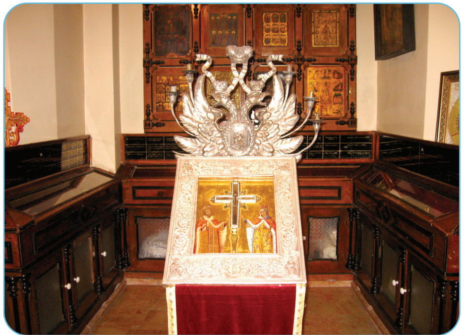
În camera tezaurului de la Biserica „Sf. Mormânt” se găsește un fragment din lemnul Sfintei Cruci descoperite de Sfânta împărăteasă Elena, mama Sfântului împărat Constantin

Victoria de la Pons Milvius a determinat pe Constantin să înțeleagă mai bine necesitățile creștinilor și să fundamenteze statutul noii religii,