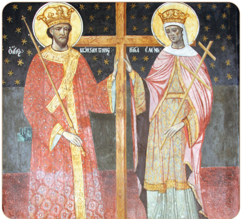
Sfinții Împărați Constantin și Elena, Catedrala arhiepiscopală din Roman (frescă, sec. al XVIII-lea)

a) Criza politică, militară și socială (divizarea conducerii tetrarhice, luptele interne pentru putere și slăbirea autorității imperiale; războaiele pentru asigurarea stabilității imperiului; diversitatea etnică și culturală a imperiului, cauze ale instabilității societății romane) și criza religioasă și morală (confruntarea dintre păgânism și creștinism; influențe ale curentelor filozofico-religioase