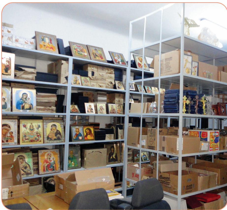
Centrul eparhial din Roman are un nou sediu de desfacere-colportaj, pus sub patronajul „Sf. Dionisie Exiguul”

S-au remontat panourile solare pe acoperișul centralei ce produce agentul termic pentru Vilele de protocol „Episcop Lucian Triteanul”, panouri care fuseseră scoase din funcțiune în toamna