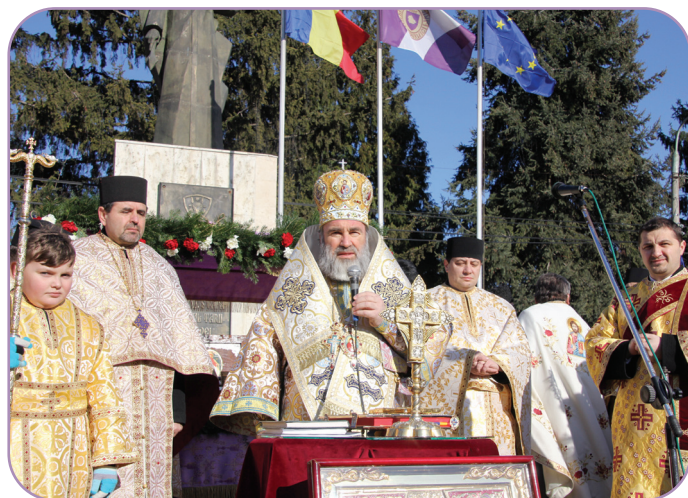
În centrul orașului Roman, înainte de a începe procesiunea, PS Părinte Episcop Ioachim Băcăuanul a rostit rugăciunea de sfințire a icoanelor