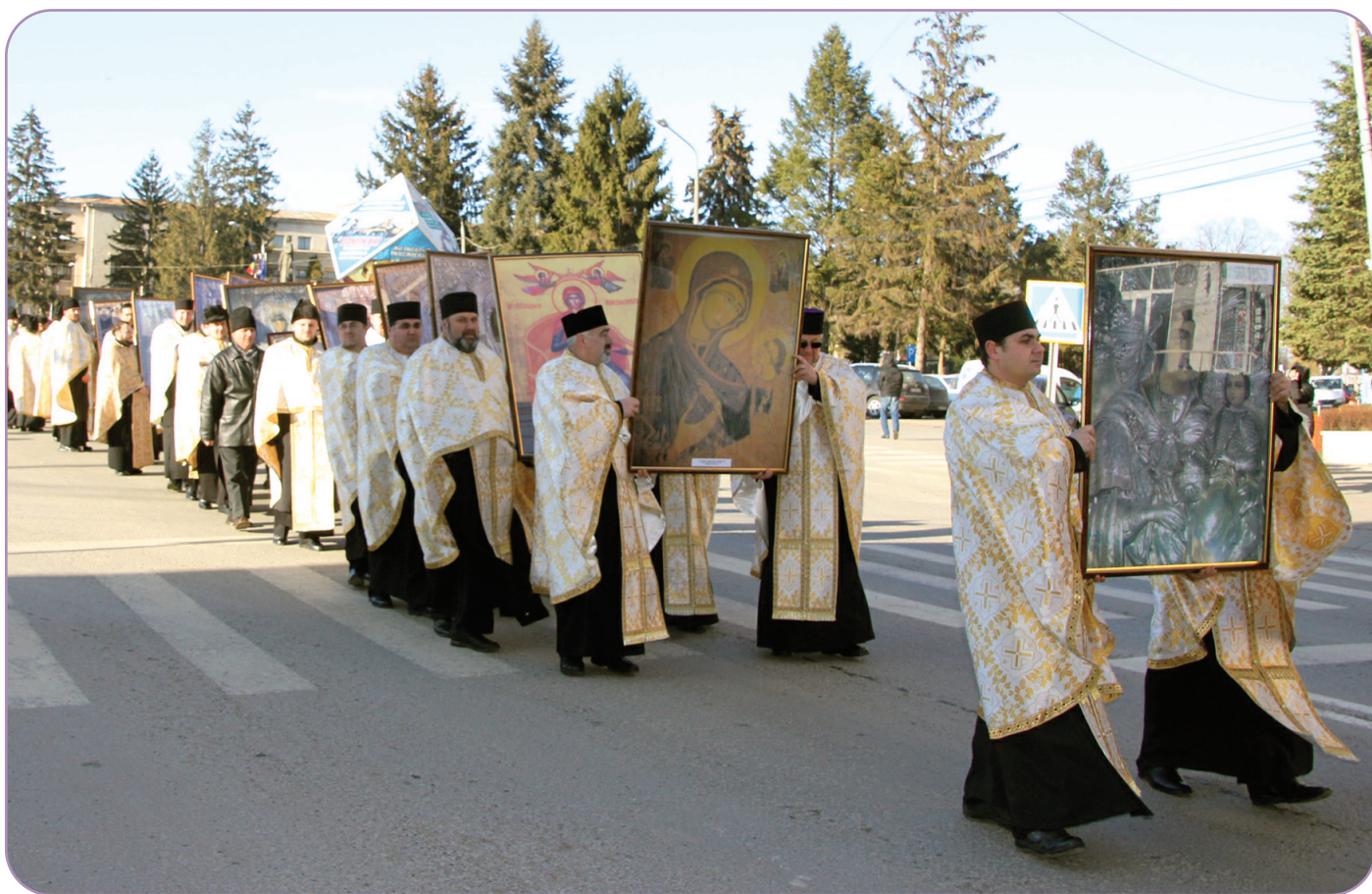
Sute de credincioși au participat la procesiunea cu Sfintele icoane organizată la Roman, în Duminica Ortodoxiei