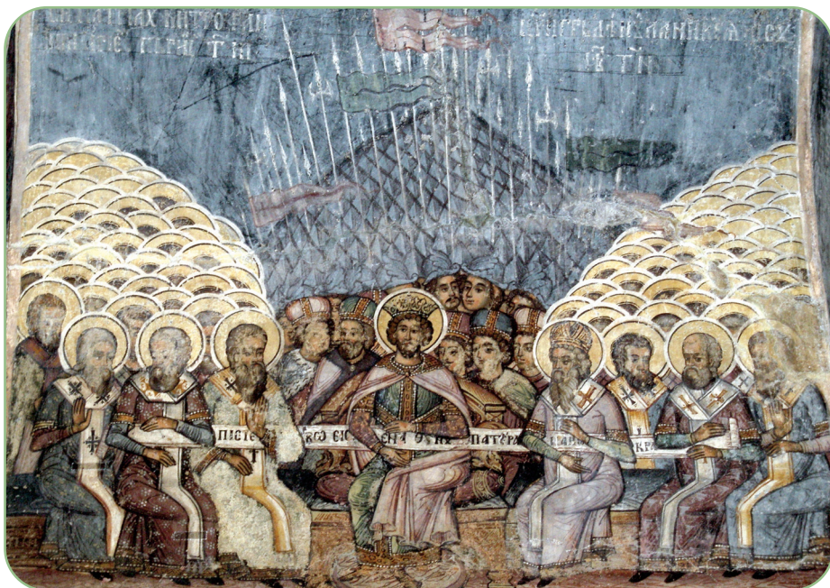
Sinodul ecumenic de la Niceea

Am crezut că este necesar să aducem la cunoștință solicitudinii tale aceste decizii cât mai pe larg, spre a te convinge că le-am acordat numiților creștini îngăduința deplină și absolută de a-și practica religia“.