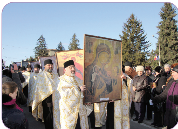
În drum spre Catedrala arhiepiscopală din Roman, sfintele icoane au fost întâmpinate cu evlavie de credincioși care s-au alăturat procesiunii