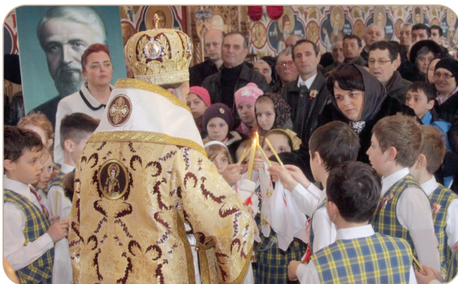
La Sf. Liturghie din ziua hramului au participat elevi de la Școala „Ghiță Mocanu” din Onești și de la Școala Mănăstirea Cașin, care au prezentat apoi câteva imne și poezii creștine ale Sfinților Trei Teologi: Sfântul Simeon Noul Teolog, Sfântul Grigorie Teologul și Sfântul Ioan Evanghelistul

Această extraordinară tâlmăcire a fost celebrată în Biserica ce poartă hramul Sfântului Simeon Noul Teolog într-o frumoasă și inspirată adunare, ce poartă numele de Cenaclu. În prezența păstorului Romanului și Bacăului, PS Părinte Ioachim Băcăuanul, a avut loc o sărbătoare a cuvântului simeonian, prilej de reflecție asupra puterii cuvântului, într-o vreme în care cuvântul pare a avea doar rolul de vehicul al informației. O foarte bună și inspirată inițiativă de a organiza un recital al poeziei creștine”, a declarat în încheiere profesorul Dan Chițoiu. (Ctîn CIOFU)