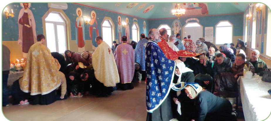
Cincisprezece preoți au oficiat taina Sf. Maslu la Centrul rezidențial de la Hârja, în ziua de 10 aprilie 2013

Persoanele internate la Hârja au dorit să fie aproape de preoții care susțin constant activitatea social-filantropică prin vizitele și colectele din comunitățile pe care le păstoresc. Momentul de rugăciune s-a bucurat și de prezența credincioșilor din parohia noastră, care susțin misiunea socială a Bisericii. Ne-am dorit un prilej de rugăciune pentru ca Duhul Sfânt să se reverse asupra bolnavilor. Prin această slujbă am intrat în