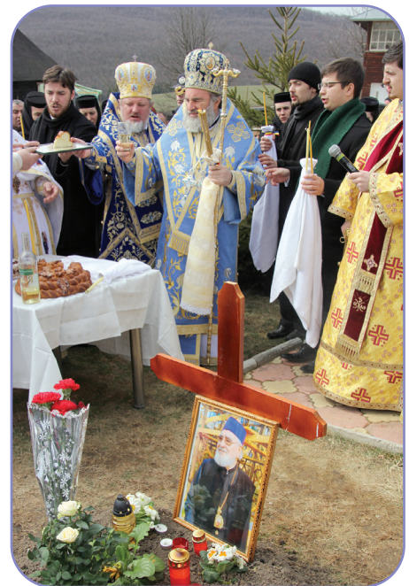
În ziua de 25 martie, PS Părinte Ioachim Băcăuanul a oficiat împreună cu PS Varlaam Ploieșteanul, episcop vicar patriarhal, Slujba de parastas pentru arhiepiscopul Adrian Hrițcu, la împlinirea a 40 de zile de la trecerea la cele veșnice

- audiențe și lucrări de birou; - sedința Permanentei Consiliului eparhial; - a acordat un interviu pentru TVR;