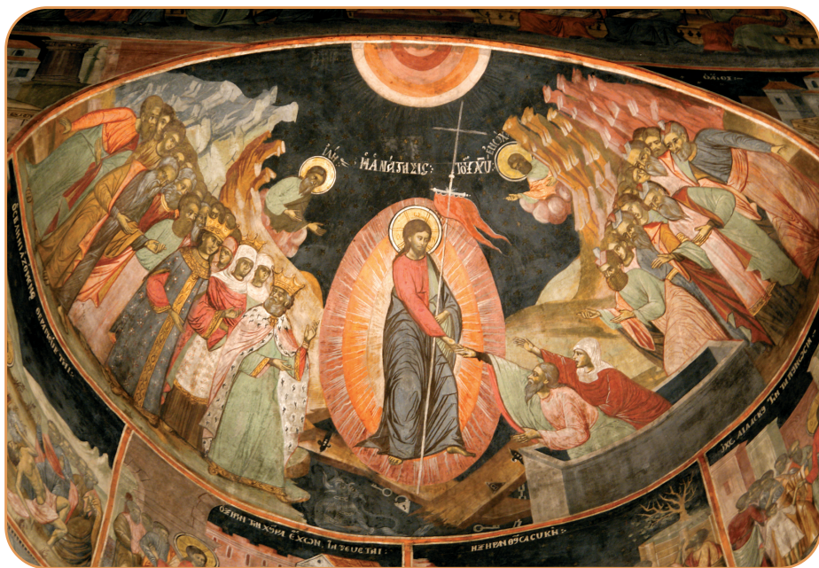
Învierea Domnului, frescă din Catedrala arhiepiscopală „Sf. Cuv. Parascheva” din Roman

În prima zi a săptămânii, Iisus se arată și ucenicilor adunați într-un Cenaclu, ascunși de frica