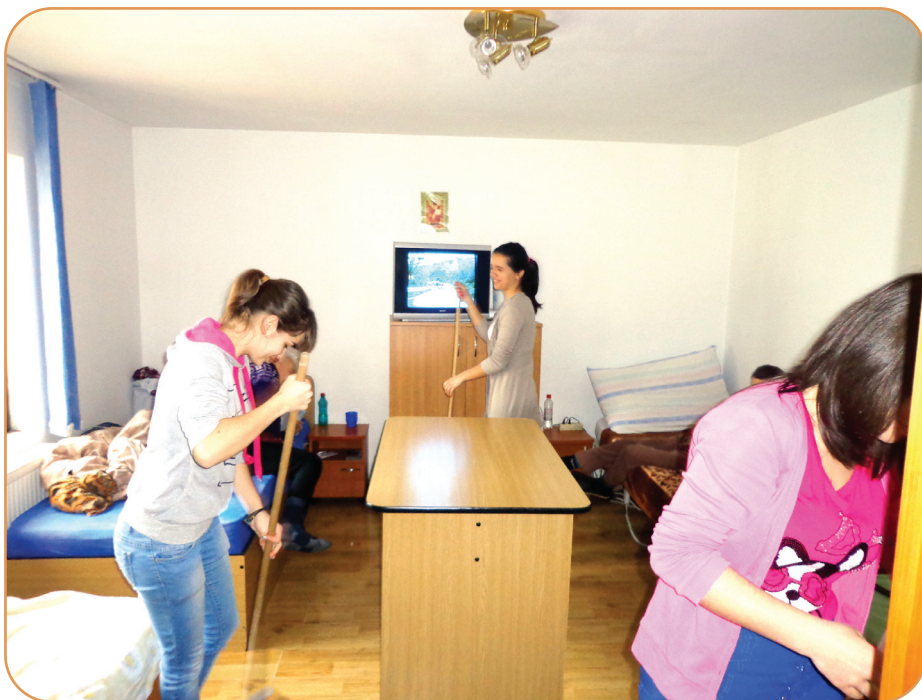
Elevii din clasa a X-a F de la Colegiul Național „Dimitrie Cantemir“ din Onești au desfășurat activități de voluntariat în cadrul Centrului Rezidențial de la Hârja