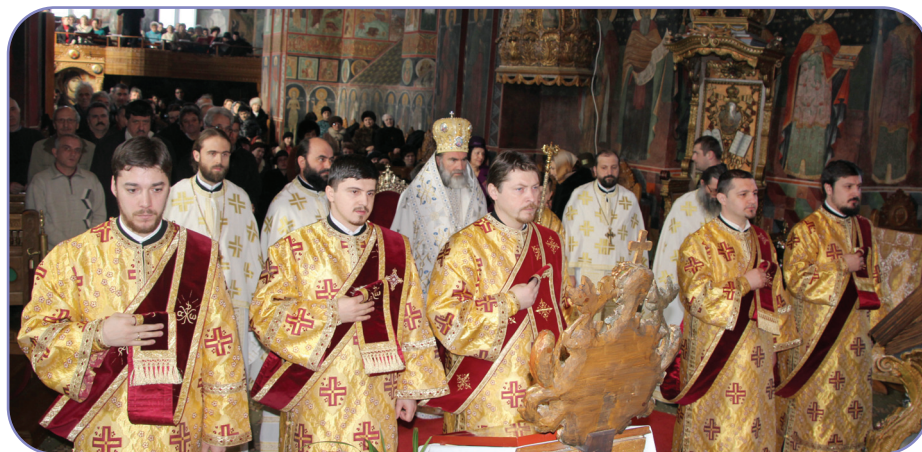
Pe 3 martie, PS Părinte Ioachim Băcăuanul a oficiat Sfânta Liturghie în Catedrala arhiepiscopală „Cuvioasa Parascheva”, Roman

- a oficiat Sfânta Liturghie la Catedrala arhiepiscopală „Cuvioasa Parascheva”, Roman;