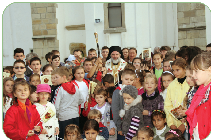
Roman, 15 septembrie 2013