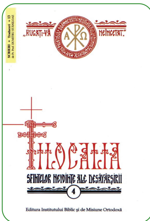
Filocalia, în traducerea Părintelui Stăniloae, a apărut între anii 1946 și 1980