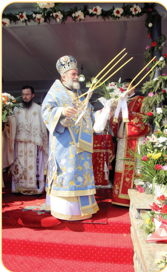
Liturghie arhierescă în ziua hramului, la Mănăstirea Giurgeni

În anul 1809 se atestă existența schitului Giurgeni, care făcea parte din ținutul Romanului, alături de alte schituri ale Episcopiei. Către jumătatea sec. al XIX-lea, schitul a fost transformat în schit de maici și apoi în mănăstire de maici. În 1928, s-au