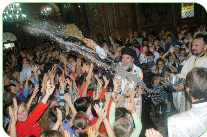
Bacău, 13 septembrie 2013