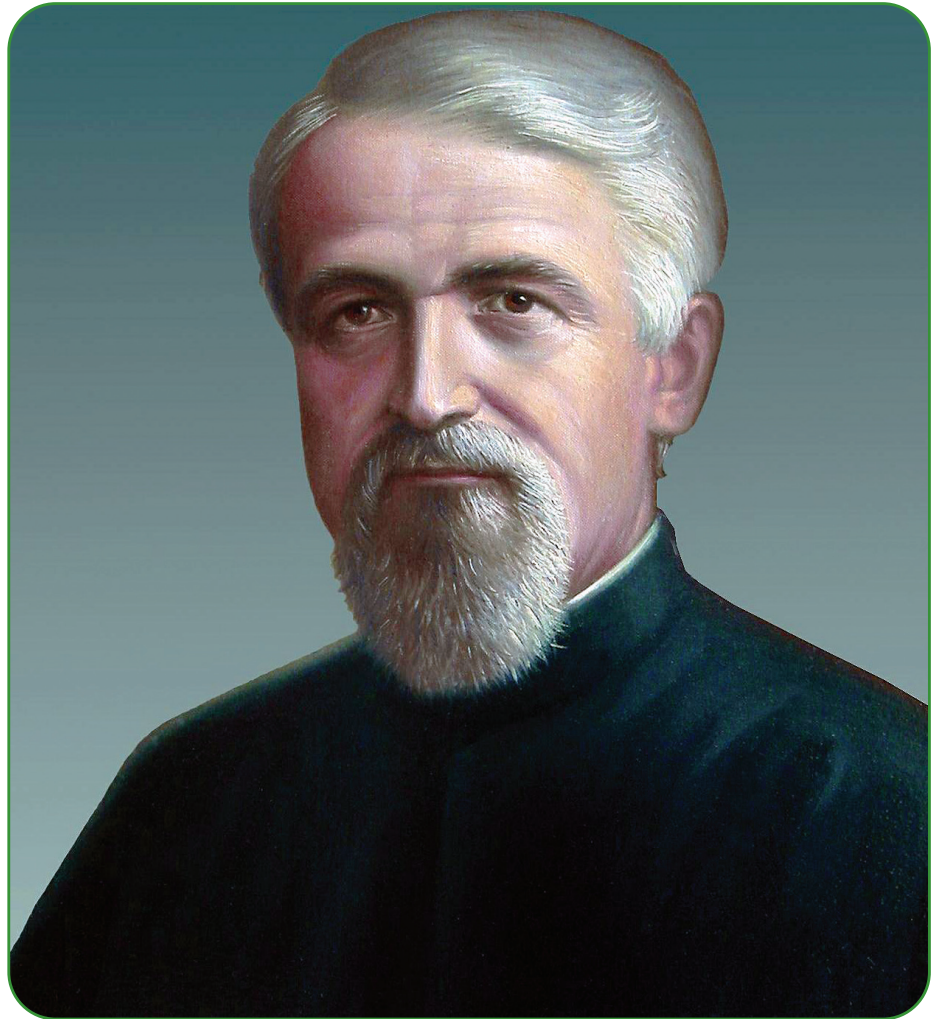
Pr. Dumitru Stăniloae (1903-1993)

Ceea ce caracterizează teologia mistică a Părintelui Stăniloae este fidelitatea raportării sale la izvoarele patristice și la experiența contemplației duhovnicești a Sfinților Părinți. Teologia sa răspunde necesității căutării identității spirituale a omului, regăsirii sinelui în raport axiologic cu „Hristos - îndumnezeitorul omului”. Omul modern, înstrăinat de Dumnezeu și greșit orientat în căutările sale spre un continuu exil auto-impus, poate găsi în antropologia filocalică a Părintelui Stăniloae o soluție pentru depășirea acestei granițe. Părintele Stăniloae propune acceptarea unei perspective ce prezintă omul ca pe o ființă transparentă în care și prin care Dumnezeu este prezent și lucrează în lume.