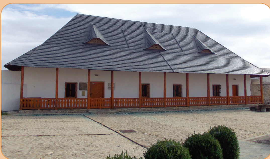
După restaurare în Casa Veniamin din incinta Catedralei arhiepiscopale din Roman sunt expuse o parte dintre exponatele care se află în depozitul muzeului eparhial

În incinta ansamblului arhitectural al Catedralei Arhiepiscopale din Roman se află clădirea cunoscută sub numele de „Casa Veniamin Costachi”. Ridicată în sec. al XVIII-lea, clădirea îi este atribuită ierarhului cărturar care a păstorit la Roman între anii 1796 - 1802. Vestigiile arheologice indica ridicarea acestui edificiu pe locul unor construcții mai vechi datate în secolul al XVI-lea.