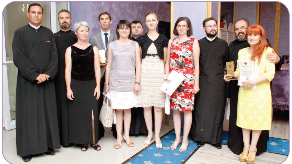
Coordonatorii serviciilor sociale care funcționează sub tutela Arhiepiscopiei Romanului și Bacăului au fost premiați și felicitați în cadrul Galei Serviciilor Social-filantropice