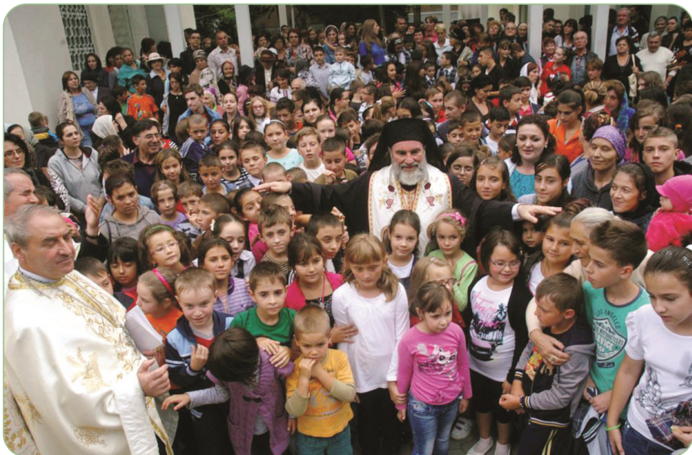
Vineri, 13 septembrie a.c., PS Părinte Episcop Ioachim Băcăuanul i-a binecuvântat pe copiii veniți la Biserica „Sf. Gheorghe” din Bacău