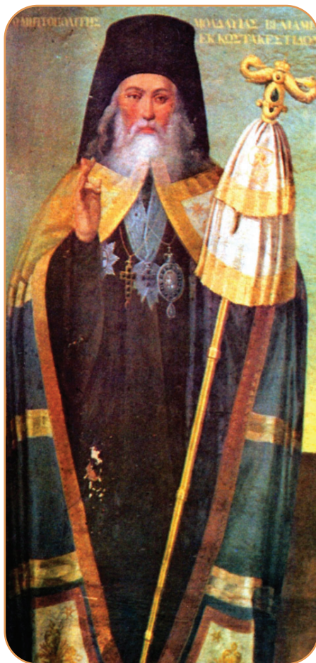
Mitropolitul Veniamin Costachi al Moldovei (1768-1846)

Hirotonit ierodiacon și ieromonah, rânduit apoi eclesiarh al Catedralei mitropolitane din Iași, după scurt timp a fost numit egumen pe seama Mănăstirii „Sfântul Spiridon” din Iași.