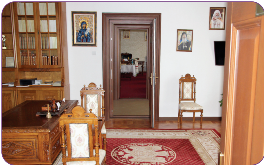
La Centrul eparhial Roman s-au executat lucrări de reamenajare și modernizare a birourilor administrației eparhiale

Urmare a hotărârii Adunării eparhiale din data de 11 iunie 2013, care prevedea transformarea bisericii din Valea Budului în metoc chiriarhal s-au