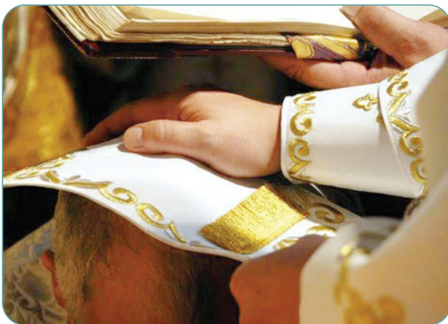
Duhovnic nu poate fi decât cel investit cu această putere de către episcop