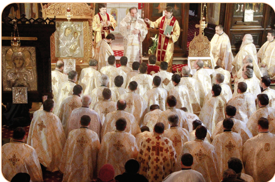
Reuniți în sinaxă, preoții româșcani s-au împărtășit din același potir și apoi au îngenunchiat în timpul rugăciunii de dezlegare citite de către Preasfințitul Părinte Ioachim Băcăuanul

A devenit o tradiție ca, la început de an, preoții Protopopiatului Onești să se întâlnească în rugăciune la Catedrala „Pogorârea Sfântului Duh”. Anul acesta, în contextul Anului Omagial