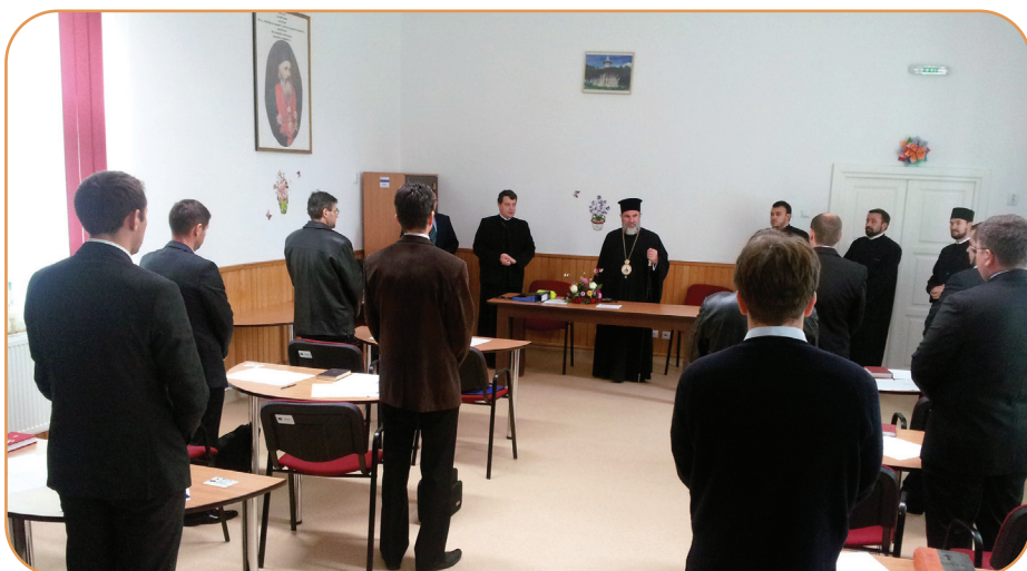
În prezența PS Părinte Episcop Ioachim Băcăuanul, aspiranții la preoție au susținut examen de Capacitate

Preasfințitul Episcop-vicar Ioachim Băcăuanul a avut și în anul 2013 o intensă activitate pastoral-misionară, ce s-a concretizat în: Liturghii arhieresti - 148; Sfinte Taine și Jerurgii - 127; Sfintiri biserici - 5; Resfintiri biserici - 8; Punerea pietrei de teme-