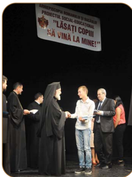
Festivitatea de premiere a șefilor de promoție de la liceele din Bacău s-a desfășurat în sala Teatrului „Bacovia“