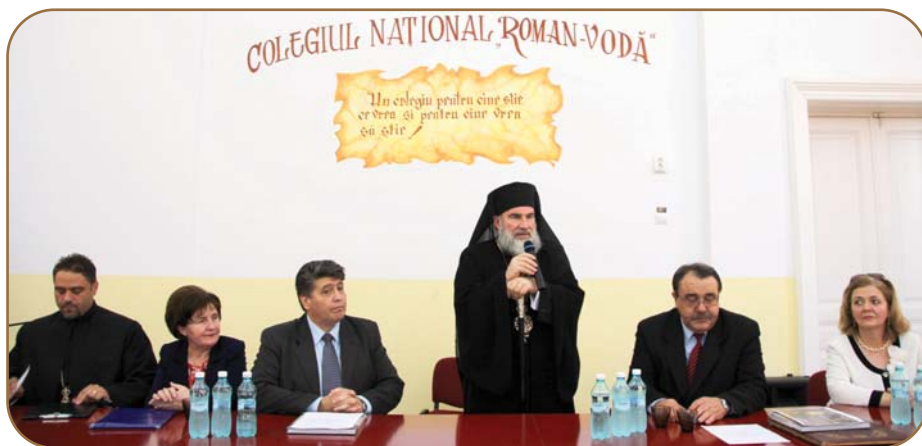
PS Episcop Ioachim Băcăuanul a fost prezent la Colegiul „Roman-Vodă“ din Roman, pentru a binecuvânta și felicita șefii de promoție ai liceelor românești