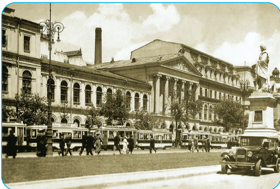
➔ În 1694 domnitorul Constantin Brâncoveanu (1688-1714) transformă Școala „Sfântul Sava”, aflată la acea dată în centrul Bucureștiului, în Academia Domnească

De asemenea, domnitorul a sprijinit activitatea tipografică, așezată dintru început sub oblăduirea Bisericii, recunoscând acesteia misiunea de luminare a poporului. S-au înființat, din veniturile domniei, noi tipografii la Buzău, Snagov, Râmnicu Vâlcea și Târgoviște, în care au văzut lumina tiparului un număr impresionant de scrieri, majoritatea acestor titluri fiind în limba română. Pondere cea mai importantă o deține, ca și în deceniile trecute, cartea de cult, însă se constată tot mai mult o diversificare a publicațiilor atât teologice (cărți de învățatură creștină și zidire duhovnicească, scrieri parenetice și pastorale), cât și laice (lucrări istorice și scrieri sapiențiale). Având credința că adevărul trebuie să fie împărtășit, tipăriturile brâncovenești s-au împărțit în dar „spre folosul de obște al neamului românesc” 3 . Acest imens volum de carte, care a circulat în întreg spațiul românesc, a transmis mesajul unității de neam, origine, limbă și cultură a românilor și hotărârea Bisericii și a instituției domnești de a depăși definitiv epoca slavonismului cultural.