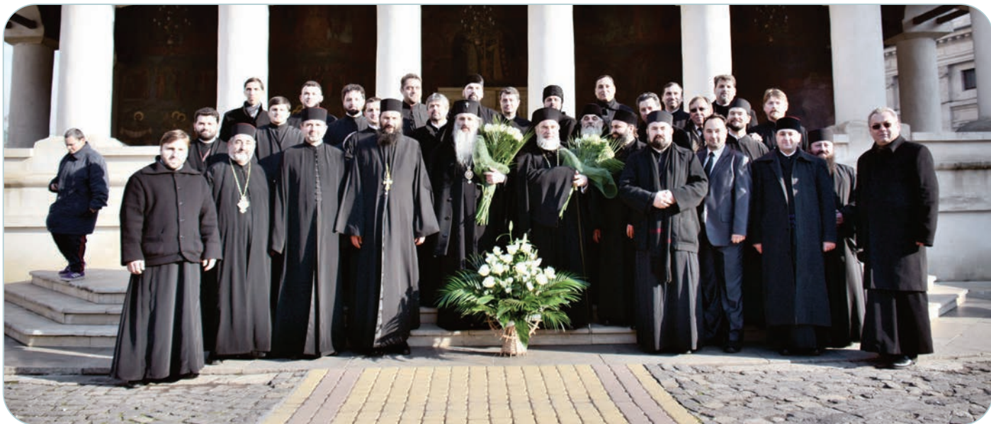
IPS Mitropolit Teofan și PS Episcop Ioachim Băcăuanul, înconjurați de reprezentanți ai clerului și credincioșilor din Arhiepiscopia Romanului și Bacăului prezenți la București în ziua de 16 decembrie a.c.