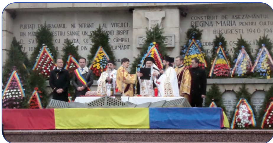
Slujbă de Te Deum la Onești, 1 decembrie 2014

Evenimentul a continuat cu marșul tuturor celor prezenți prin centrul orașului, încheindu-se cu un spectacol pregătit de cadre didactice, copii și tineri, printre care s-au numărat și copiii din cadrul Centrelor de artă și tradiție ale Asociației „Sf. Voievod Ștefan cel Mare” - Hârja, Grădina Poiana Sărată, Școala Ferăstrău și Corul Parohiei Oituz.