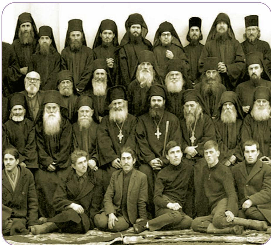
Obștea mănăstirii Sihăstria în anul 1970

De câte ori am vorbit sau am scris despre a-numiți părinți deosebiți ai Sihăstriei, am făcut referință la începuturile traseului meu în viața monahală de la Sihăstria. 1969 este anul nașterii mele spirituale. Nu aveam nici cincisprezece ani impliniți când am participat pentru prima dată la un hram de mănăstire. În ciuda opresiunii autorităților atee și a timpurilor nestatornice, credincioșii-pelerini erau prezenți în număr foarte mare la hram. Pe vremea aceea, la Sihăstria, erau mulți părinți înaintați în vârstă aduși din mănăstirile care fuseseră închise în urma aplicării decretului de tristă amintire pentru călugări, 410/1959, și care primiseră aici domiciliu forțat, pentru a fi sub observația regimului. Pentru cei ce nu cunosc locurile, trebuie spus că Mănăstirea Sihăstria este așezată pe valea pârâului Secu, în amonte, cu o singură cale de acces rutier. Din punctul de vedere al autorităților vremii, acolo era un loc strategic bine ales, unde se putea controla foarte ușor fluctuația persoanelor de la cele două mari mănăstiri, Secu și