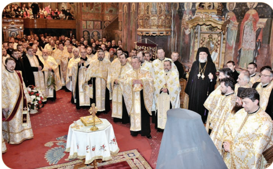
Catedrala arhiepiscopală „Sf. Cuvioasă Parascheva” din Roman s-a dovedit neîncăpătoare pentru mulțimea credincioșilor și preoților veniți în întâmpinarea ierarhului