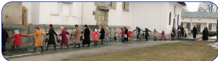
Hora Unirii în jurul Catedralei arhiepiscopale din Roman