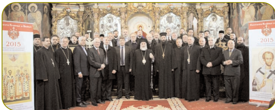
Lucrările Adunării Eparhiale au debutat cu oficierea unei slujbe de mulțumire în Catedrala arhiepiscopală din Roman