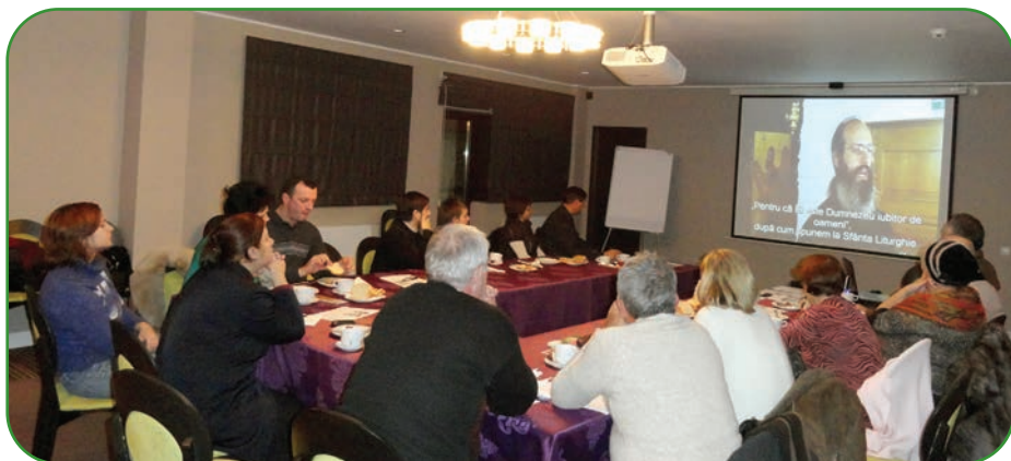
Proiectul catehetic pentru adulți „Calea Mântuirii” a fost implementat și finalizat de 13 unități de cult de pe cuprinsul Eparhiei Romanului și Bacăului

În anul 2014 au fost organizate 24 de conferințe lunare cu preoții și conferințe pastoral-misionare semestriale, cu participarea ierarhului sau