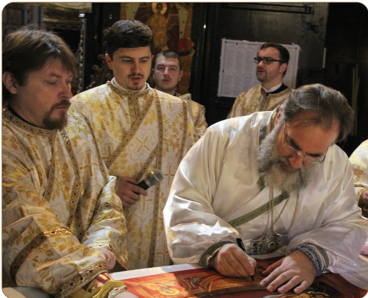
În ziua de pomenire a Cuviosului Antipa, ocrotitorul eparhiei, IPS Părinte Ioachim a sfințit noul antimis chiriarhal

➔ în soborul preoților Protopopiatului Roman, în una dintre cele mai reprezentative biserici ale eparhiei și în același timp cea mai mare catedrală din mediul rural“, a precizat ierarhul în cuvântul său. „Alt context al întâlnirii de astăzi este cel al distribuirii Sfintelor Antimise preoților din protopopiatul Roman. Antimisul este unul dintre cele mai importante obiecte din biserică, deoarece îl ajută pe preot la desfășurarea ritualului liturgic. Antimisele împărțite astăzi sunt realizate după o icoană pictată în atelierelor Mănăstirii Diaconesti și poartă particule din moaștele sf. Teodosie de le Brazi. Acum, în contextul serbării Anului Omagial consacrat misiunii parohiei și mănăstirii, antimisele vor fi dăruite fiecărei biserici. Acestea sunt tot atâtea motive ce ne îndeamnă să rămânem în unitatea liturgică, dogmatică și canonică statornicită de Sfinții Părinți ai Creștinătății“, a mai menționat IPS Ioachim.