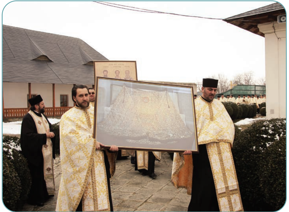
Procesiune cu icoana Sfântului Ioan Gură de Aur și o imagine a felonului Sfântului. Originalul se află în muzeul Centrului eparhial de la Roman.

al Sfântului Ioan Gură de Aur, la Catedrala Arhiepiscopală „Sf. Cuv. Parascheva” din Roman a avut loc, în ziua de 27 ianuarie, un eveniment prin care a fost marcată personalitatea marelui ierarh al creștinătății. Acesta a debutat cu Sfânta Liturghie, după care Înaltpreasfințitul Arhiepiscop Ioachim a rostit un cuvânt de învățătură în care a vorbit despre viața și activitatea Sfântului Ioan Hrisostom. „Urmând hotărârea Sfântului Sinod, astăzi, la Centrul eparhial, începem manifestările dedicate Sfântului Ioan Gură de Aur și marilor păstori de suflete. Urmând exemplul său încercăm și noi să marcăm timpul nostru. Pentru Centrul eparhial de la Roman, sărbătoarea de astăzi are o conotație deosebită, deoarece aici se găsește, în colecția muzeistică, felonul Sfântului Ioan Hrisostom dăruit acestei eparhii încă din timpul lui Alexandru cel Bun. Așa cum se știe, acest voievod, datorită legăturilor prietenești avute cu Manoil Paleologul, în semn de prietenie, a primit din partea acestuia trei doare bisericești: icoana făcătoare de minuni de la Mănăstirea Neamț, icoana Sfintei Ana de la Bistrița, iar aici, la Roman, în Țara de Jos, felonul Sf. Ioan Gură de Aur. Avem, de asemenea, documente ce atestă existența și autenticitatea acestui veșmânt”, a menționat IPS Ioachim în cuvântul său.