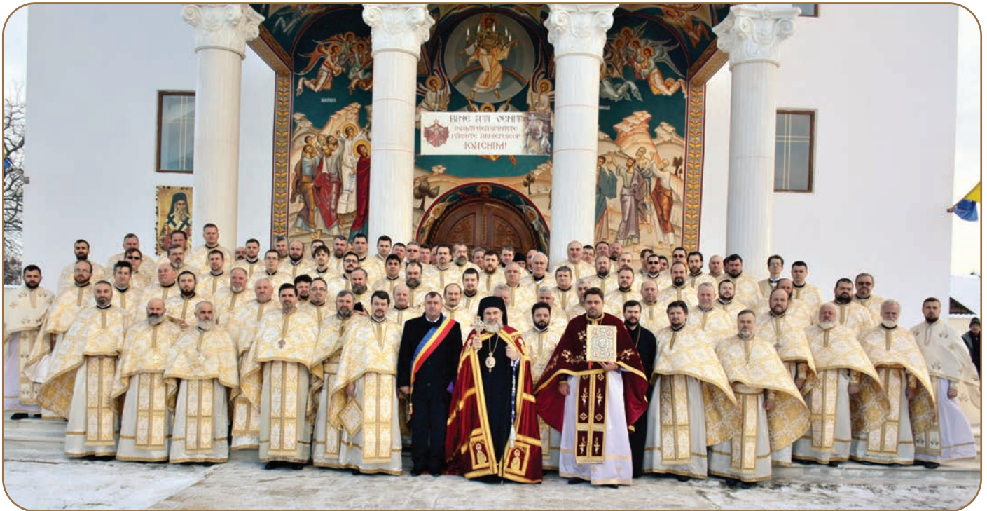
Sinaxa preoților din Prototipiul Roman, 9 februarie