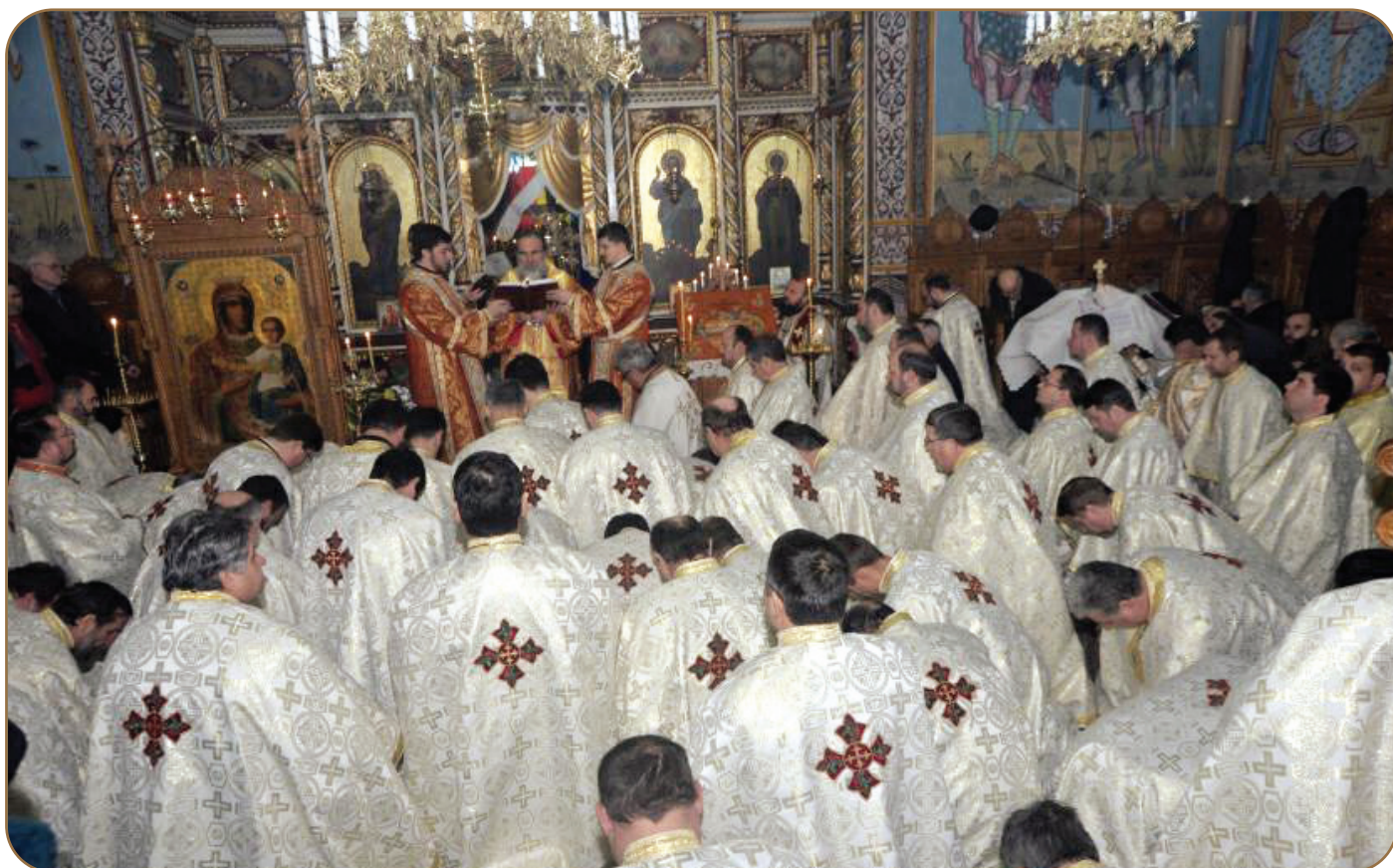
Sinaxa preoților din Protopiatul Sascut, 29 ianuarie

În ziua de 9 februarie, la Biserica „Înălțarea Domnului“ din Cotu Vameș, a avut loc sinaxa preoților din Protopopiatul Roman. Înaltpreașfințitul Părinte Ioachim, Arhiepiscopul Romanului și Bacăului, a fost întâmpinat de tinerii elevi ai școlii din localitate, îmbrăcați în veșmânt de sărbătoare, precum și de cei peste o sută de preoți prezenți la eveniment. Înainte de oficierea Sfintei Liturghii, Înaltpreașfinția Sa a precizat motivația întâlnirii în comuniunea de slujire liturgică și rolul antimisului în viața de parohie. „În ziua în care Ortodoxia serbează Odovania praznicului Întâmpinării Domnului, ne-am adunat pentru a ne împărtăși cu Trupul și Sângele Domnului nostru Iisus Hristos, pentru a fi în comuniune în jurul potirului euharistic al dragostei lui Hristos, în sinaxă, pentru a comunica liturgic