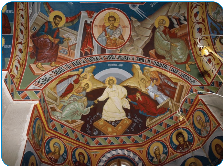
În anul 2014, pe cuprinsul Arhiepiscopiei Romanului și Bacăului au fost deschise peste 32 de lucrări de repictare și restaurare de pictură bisericească

Urmare acestei acțiuni, în anul 2014, a fost colectată suma de 186.280 lei, din care a fost trans-