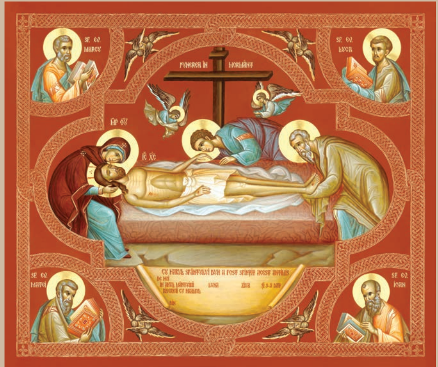
Icoana Punerii în mormânt a Mântuitorului, lucrată de maicile de la Mănăstirea „Adormirea Maicii Domnului”, Diaconești, a devenit Sfântul Antimis al noului chiriarh al Romanului și Bacăului, IPS Părinte Ioachim

După ce a fost pregătit un număr de antimise potrivit cu numărul bisericilor din eparhie, în acestea sunt puse părticele din moaștele unui sfânt mucenic, iar ierarhul, înainte de oficierea Sfintei Liturghii, săvârșește slujba de