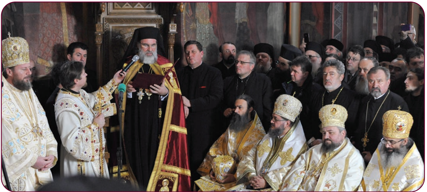
Noul arhiepiscop a rostit un cuvânt adresat atât participanților la ceremonia de învestire, cât și tuturor credincioșilor încredințați spre păstorie

bil, cultural-religios, liturgic sau editorial, încât mi-ar mai trebui ceva din timpul acesta efemer să le împlinesc, însă, încă o dată, numai Dumnezeu știe câte-mi sunt date să realizez!