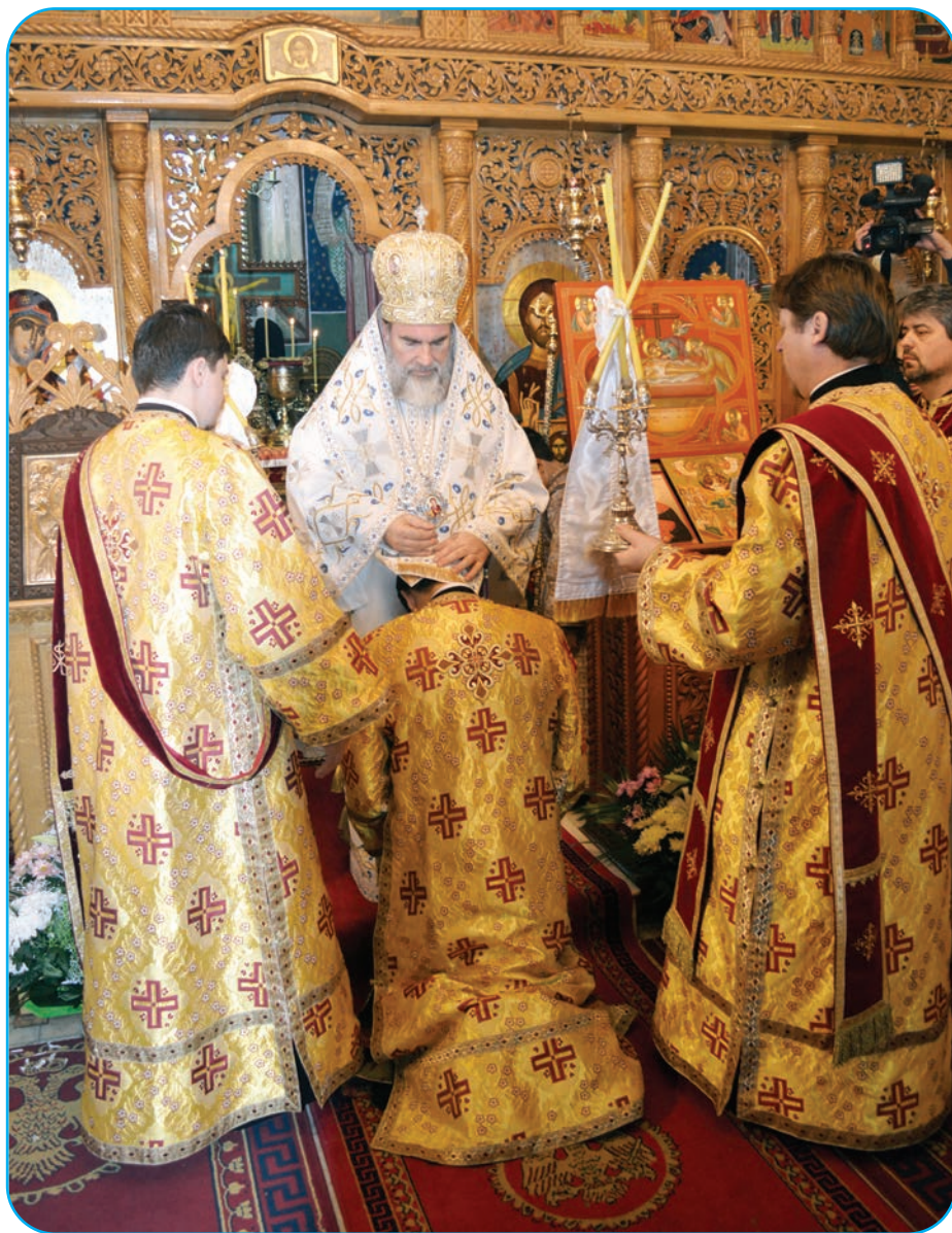
Pe parcursul anului 2014, IPS Părinte Ioachim a hirotoni 20 de noi slujitori

Pentru anul 2015 ne propunem să continuăm administrarea și completarea bazelor de date statistice existente și adaptarea lor continuă la cerințele administrative din partea sectoarelor Centrului Eparhial, ale forurilor superioare sau ale altor instituții cu care colaborăm.