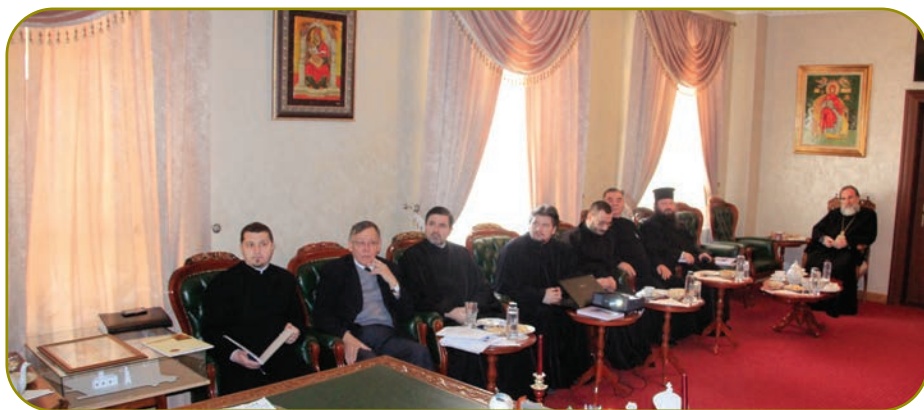
Întrunirea membrilor Consiliului Eparhial a precedat reunirea Adunării Eparhiale a Arhiepiscopiei Romanului și Bacăului