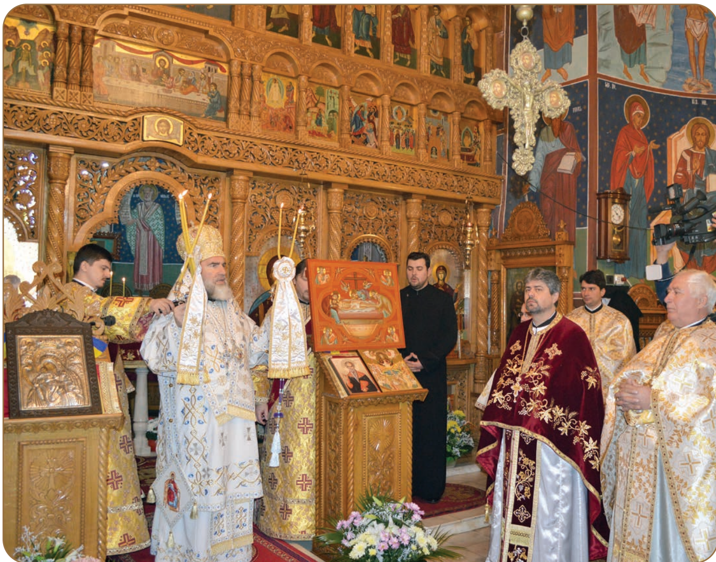
Sinaxa preoților din Protopiatul Moinești, 10 februarie

liturgică, dogmatică și canonică a slujirii preoților în sinaxă, precum și semnificațiile teologice și administrative ale Sfântului Antimis pentru activitatea misionară a preotului în parohia în care activează. Alături de Sfântul Antimis preoților le-a fost înmănat Sfântul și Marele Mir precum și un volum ce cuprinde rânduielile tipiconale ale slujbelor religioase ce vor fi săvârșite în acest an.