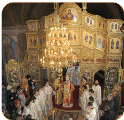
Liturgia de hram la parohia „Sf. Ioan“ din Bacău a fost oficiată de IPS Arhiepiscop Ioachim înconjurat de un sobor de preoți și diaconi