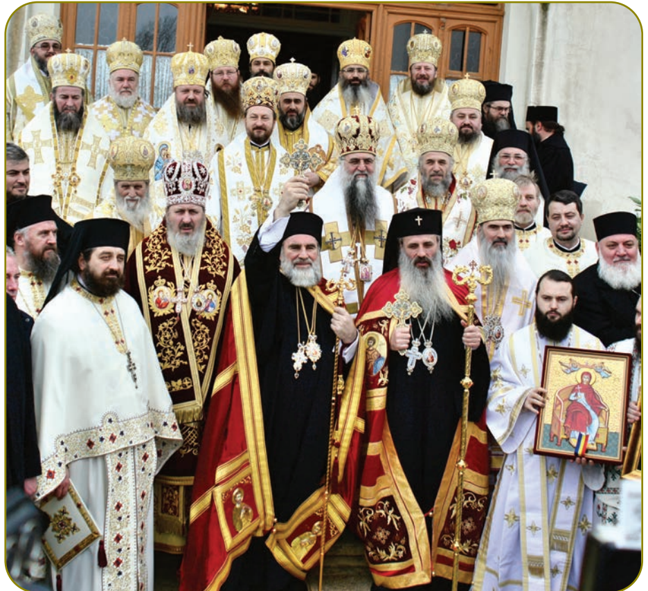
Prezentarea solemnă a IPS Părinte Ioachim ca Arhiepiscop al Romanului și Bacăului s-a făcut de către IPS Părinte Mitropolit Teofan, în prezența mai multor membri ai Sfântului Sinod al BOR

Chemat fiind, prin alegerea Sfântului Sinod, la această sublimă misiune și apoi, astăzi, proclamat în mod solemn ca Arhiepiscop al acestui