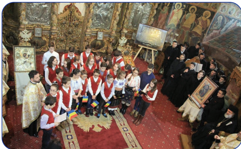
De Ziua Unirii, în Catedrala din Roman au fost prezenți elevi din patru dintre școlile orașului