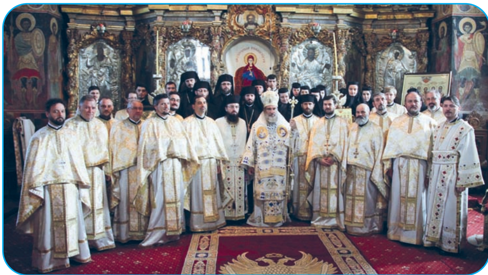
Sf. Pahomie de la Gledin, episcopul Romanului, a fost cinstit cu mare evlavie la Catedrala Arhiepiscopală „Sf. Cuvioasă Parascheva” din Roman

Sărbătoarea Învierii Domnului a continuat în cea de-a treia zi a Sfințelor Paști la Catedrala Arhiepiscopală „Sf. Cuv. Parascheva” din Roman, în ziua de prăznuire a Sfântului Pahomie de la Gledin, episcopul Romanului.