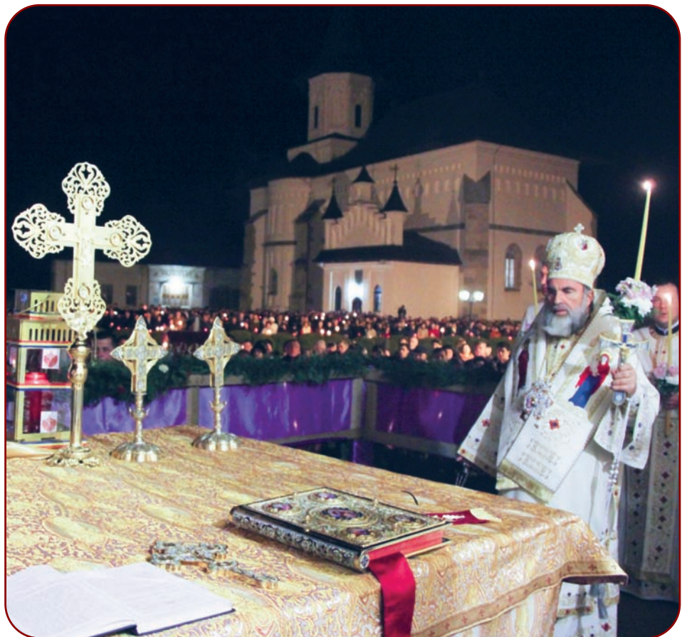
Noaptea Învierii Domnului la Catedrala arhiepiscopală din Roman (12 aprilie 2015)

Data în reședința noastră arhiepiscopală de la Roman, 12 aprilie 2015.