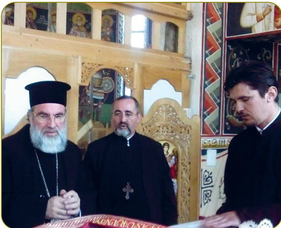
Vizită de lucru pe șantierul de la Schitul „Sf. Împărați Constantin și Elena” - Codreanu