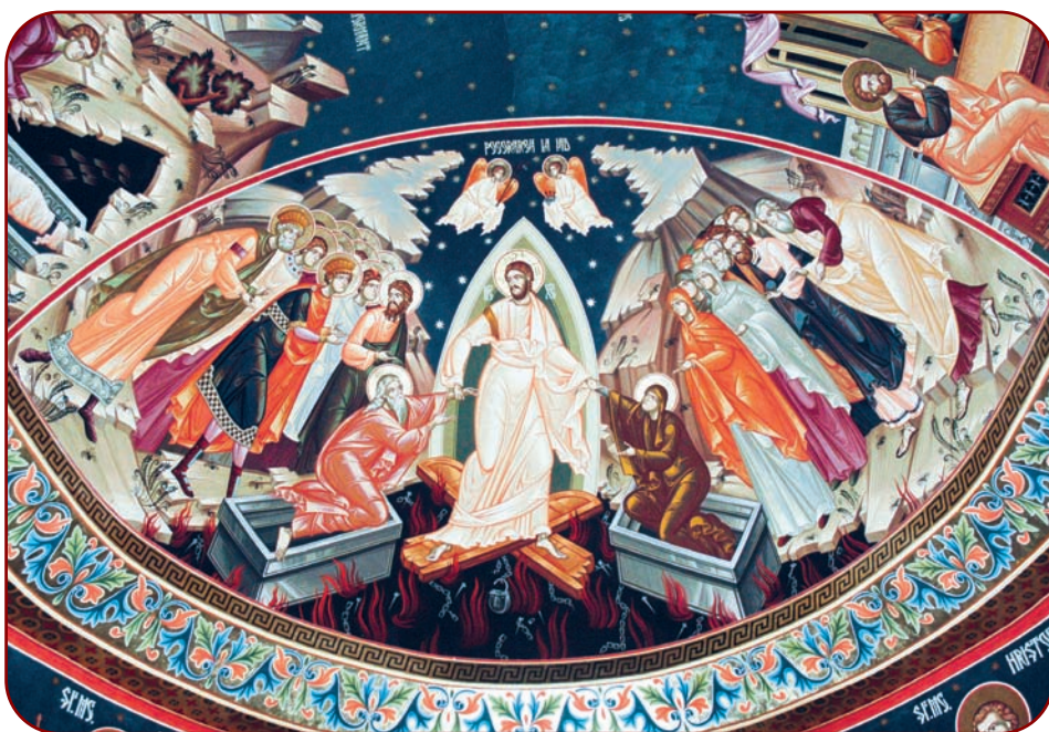
Pogorârea la Iad, Biserica „Sfântul Dumitru” Bacău

Așadar, slujba învierii se săvârșește în afara spațiului cultic, arătând prin aceasta că întreaga comunitate ecleziastică este integrată în universul lui Dumnezeu și este acoperită de manta luminii care s-a propagat dintru început în nonexistență, când Cuvântul, adică Verbul creator, a fost auzit și s-au făcut toate după felul lor (cf. Ioan, 1, 3). Lumina aceasta necreată, apoi împărțită creaturilor, cu Duhul lui Dumnezeu ce Se purta odinioară pe deasupra oceanului infinit, s-a odihnit în Cuvântul lui Dumnezeu, care, la plinirea vremii, S-a făcut trup și S-a sălășluit întru noi, și am văzut slava Lui, slavă ca a Unuia-născut din Tatăl, plin de har și de adevăr (Ioan 1,14). Acest Cuvânt s-a prezentat lumii ca fiind Lumina tuturor celor care vin în lume ca ființe psiho-somate, conștiente: Eu sunt lumina lumii; Cel care Îmi urmează Mie, nu va umbla întru întuneric, ci va avea lumina vieții (Ioan 8, 12).